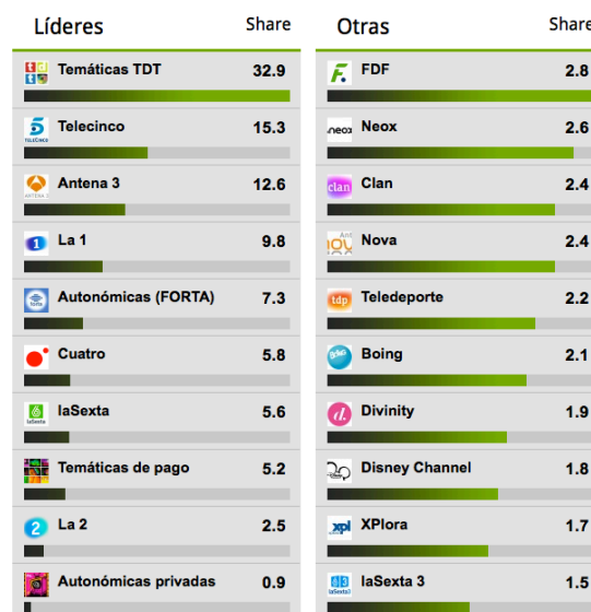
Figura 2: Se observa cómo entre las diez cadenas más vistas de la TDT (columna derecha) se encuentran Clan, Boing y Disney Channel.

Eso sí, gracias a este público los tres canales temáticos infantiles principales (Clan TV, Boing y Disney Channel) están cada semana en el top ten de los más vistos de la Televisión Digital Terrestre (TDT). Así, solo nos queda dejar en el aire la siguiente pregunta: ¿volverán los programadores de las cadenas generalistas a tener interés por los niños? ¿Volverá la ilusión por crear contenidos entretenidos y didácticos, hechos por y para ellos? ¿Tendrán las siguientes generaciones un día y una hora claves en su calendario para ver una nueva edición de su programa favorito, como hizo en su día La Bola de Cristal ? ¿O están estos contenidos abocados a estancarse en la simplicidad de la programación en cadena de los canales temáticos?