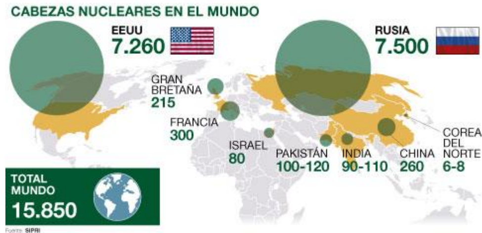
Ilustración 1. Países con grandes arsenales nucleares