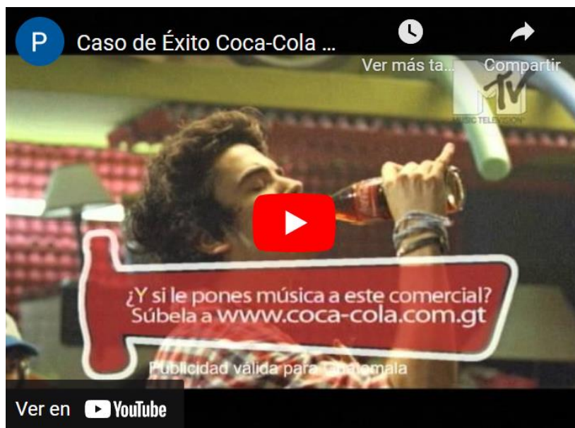
Vídeo Campaña Coca-Cola MyWay