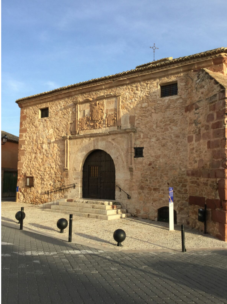
Antigo celoiro de Campo de Criptana