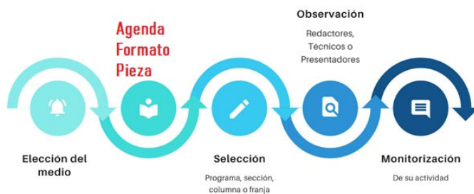
FIGURA 3. Proceso de elaboración del proyecto