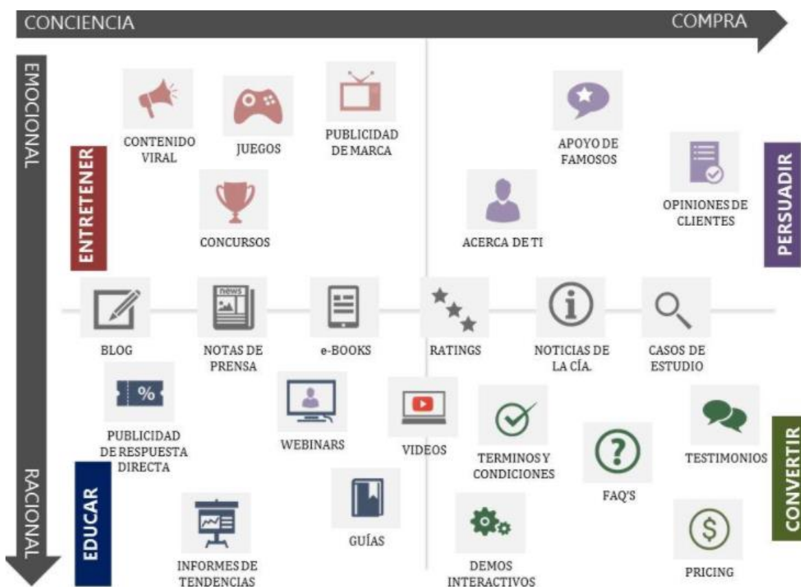
Gráfico 3.4.b. Matriz de marketing de contenidos de Dave Chaffey de Smarts Insights