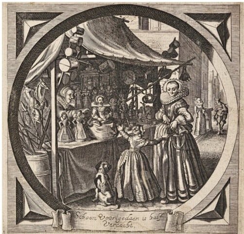
Fig. 3. Escuela holandesa, El puesto de juguetes , 1632. Grabado del libro de Jacob Cats, Espejo de tiempos antiguos y nuevos (Spiegel van den ouden ende nieuwen tijdt) , 13,4 x 13,4 cm, Núm. Inv.: 1952. 0117.14.13. Londres, British Museum