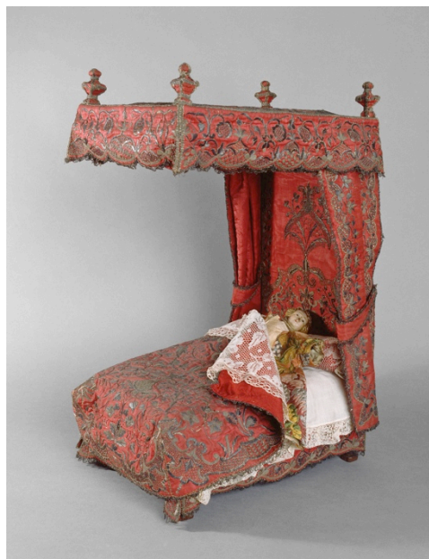
Fig. 7. Anónimo, Cama de muñecas , s. XVII. Madera y tafetán de seda con bordado metálico, 52,5 x 37 x 23 cm. Núm. Inv.: ECL-19592. Écouen, Museo Nacional del Renacimiento

El 20 de julio de 1569, De la Vega confeccionó otras dos colchas de tafetán para las muñecas de la infanta Isabel: