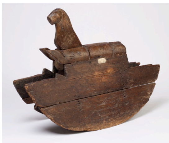
Fig. 5. Anónimo, Caballo balancín, probablemente perteneciente al príncipe Carlos I de Inglaterra , h. 1610. Madera de olmo tallada, 80 cm de alto x 112 cm de largo, Núm. Inv. B.1 – 2006 . Londres, Victoria and Albert Museum