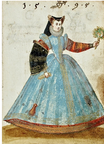
Fig. 17. Anónimo, Álbum amicorum of a German soldier , 1595. Gouache sobre papel, 15,5 x 11,4 cm. Museo de Arte de Los Ángeles.