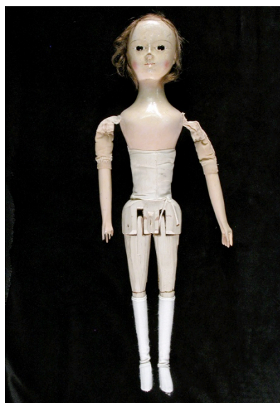
Fig. 14. Anónimo, Muñeca Pandora , 1760. Madera policromada, lino y cabello humano, altura 48,5 cm, Núm. Inv.: NT815064. Shropshire, Casa Museo Dudmaston

Los textiles para la elaboración del traje se compraron a Valverde el día 13 de abril, y ascendieron a 1766 maravedís; a razón de un corte de tafetán azul de Valencia para el verdugado (748 maravedís), otro de seda del mismo color para la saya (128 maravedís), una cuarta de tela blanca labrada de Milán para las manguillas (612 maravedís), tafetán blanco para el forro (63 maravedís), holandilla encarnada para las pestañas decorativas de la saya (62 maravedís), y dos varas de trencillas de plata de Milán para coserlas sobre dichas pestañas (153 maravedís) 77 . El vestido de la muñeca