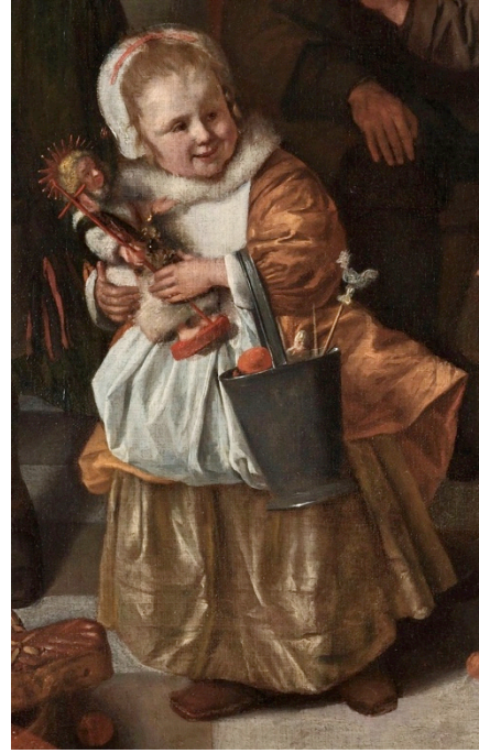
Fig. 12. Jan Havicksz Steen, La fiesta de San Nicolás (detalle de una niña con figura de San Juan Bautista), h. 1565. Óleo sobre lienzo, 82 x 70,5 cm, Inv. Núm.: SK-A-385. Ámsterdam, Rijksmuseum

Al estímulo maternal también contribuyeron las imágenes del Niño Jesús que se custodiaban en las alcobas y oratorios de palacio, pues a pesar de que prevaleció en ellas su carácter espiritual, las infantas se ocuparon de cuidarlas y cambiarles con frecuencia sus atuendos, del mismo modo que lo hacían con sus muñecas 61 . Sobre este extremo tampoco debemos olvidar la singular veneración que las comunidades conventuales femeninas tuvieron al Divino Infante. Como ocurrió en el ámbito cortesano, las religiosas atesoraron diversidad de tallas infantiles de Cristo (en la cuna, en pañales, dormido, meditando, en Majestad...), que actuaron como herramientas de consuelo con las que colmar su instinto maternal, en tanto que renunciaban a gestar y cuidar a sus propios retoños en aras de su matrimonio místico con Dios 62 (fig. 12).