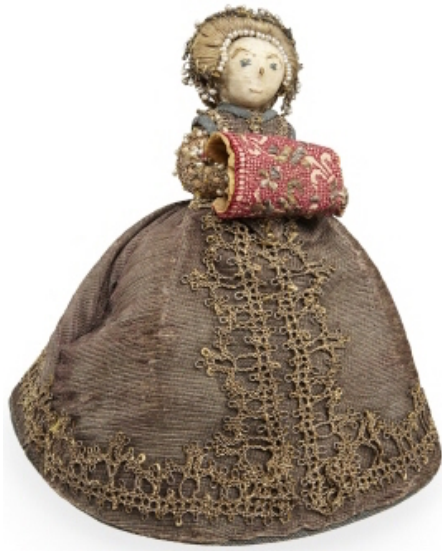
Fig. 16. Muñeca realizada por Catalina Vasa, María del Palatinado o Cristina de Holstein-Gottorp, h. 1585 – 1604 . Alambre, terciopelo, seda, randas metálicas y perlas, altura 16 cm, anchura 16,5 cm, Núm. Inv.: 77(56:15)260. Estocolmo, Armería del Palacio Real.