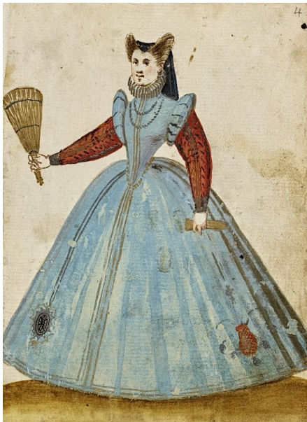
Figs. 18 . Anónimo, Álbum amicorum of a German soldier , 1595 . Gouache sobre papel, 15,5 x 11,4 cm. Museo de Arte de Los Ángeles.