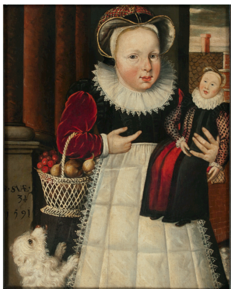
Fig. 13. Escuela holandesa, Retrato de niña de tres años (sin identificar), 1591. Óleo sobre tabla, 47,5 x 61,5 cm, Núm. Inv.: S05729. Leeuwarden, Fries Museum

«Cómprese [al mercader Bernardino de Valverde] para servicio de su alteza [la infanta doña Isabel] (...) cuatro docenas de granates finos engastados en alquimia como botones, para ponerlos a una muñeca que su alteza viste, y unos chapines de media ataujía para la dicha muñeca» 76 .