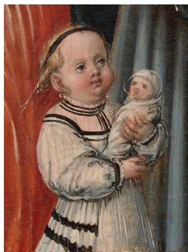
Fig. 10. Lucas Cranach «el Joven», Cristo bendiciendo a los niños (detalle), h. 1550. Óleo sobre tabla, 16,5 x 22,5 cm, Inv. Núm.: 1982.60.36. Nueva York, Metropolitan Museum