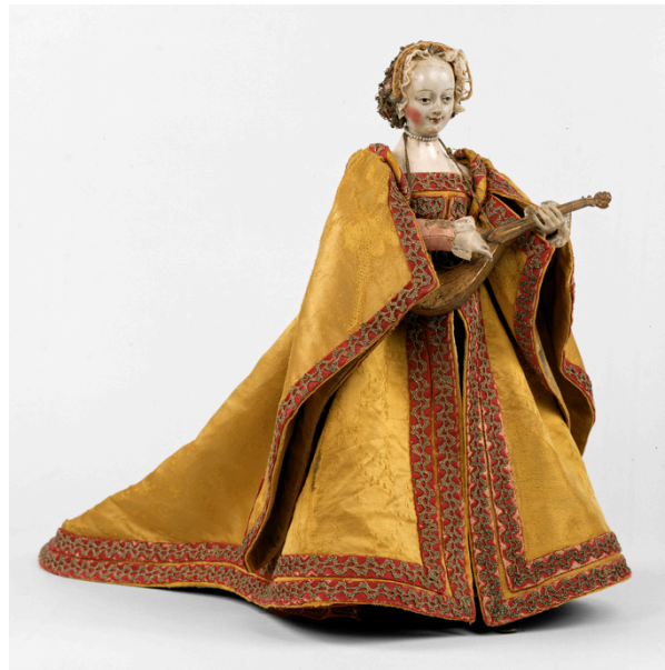
Fig. 19. Juanelo Turriano (atribución), Muñeca automática , segunda mitad del s. XVI. Madera policromada, hierro y damasco de seda, altura 44 cm, Núm. Inv.: KK_10000. Viena, Kunsthistorisches Museum.