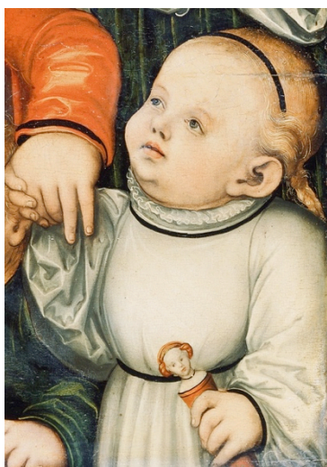
Fig. 9. Lucas Cranach «el Viejo», Cristo bendiciendo a los niños (detalle), h. 1540. Óleo sobre tabla, 83,8 x 121,5 cm, Núm. Inv.: DE_SMF_1723. Frankfurt, Städel Museum

La función de las muñecas infantiles trascendió su concepción de meros objetos de juego, hallándose en ellas un medio catalizador de la maternidad. Ha quedado expuesto que las infantas disfrutaban con estas figuras remedando las acciones que experimentaban en ellas mismas: vestir las, acostar las, darles de comer..., repitiendo e integrando aquellas tareas consideradas tradicionalmente femeninas. Las actividades de diversión con muñecas implicaban una forma didáctica de familiarizarse con los cuidados que cualquier madre proporcionaba a su hijo, por lo que debe verse en ellas ensayos que preparaban a las hijas del rey para la vida adulta. Este hecho es especialmente perceptible en las pinturas de la Europa moderna que ilustran niñas portando muñecas fajadas o en pañales, simulando recién nacidos (figs. 9 – 10 – 11), y que, con toda seguridad, también tuvieron las infantas hispanas en su niñez, ya que fueron universales para todas las clases sociales.