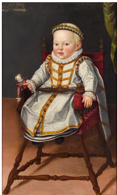
Fig. 6. Jan Cornelisz Vermeyen, Catalina Renata de Austria a la edad de un año , 1577. Óleo sobre lienzo, 190 x 64,5 cm., Núm. Inv.: GG_6934. Viena, Kunsthistorisches Museum