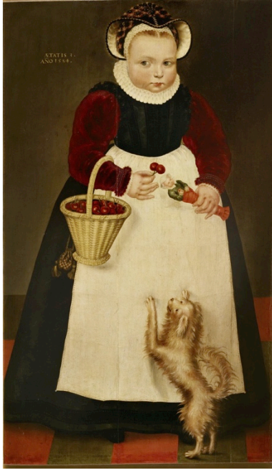
Fig. 11. Isaac Claesz van Swanenburg, Retrato de niña de tres años , 1584. Óleo sobre tabla, 98 x 56 cm, Inv. Núm.: Zh – 1882. Moscú, Pushkin Museum