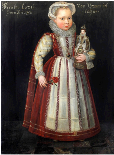
Fig. 1. Daniel van den Queborn, Retrato de Louise Juliana de Orange-Nassau , h. 1582. Óleo sobre tabla, 101 x 75 cm, Núm. Inv.: A3496. Siegen, Siegerland-museum