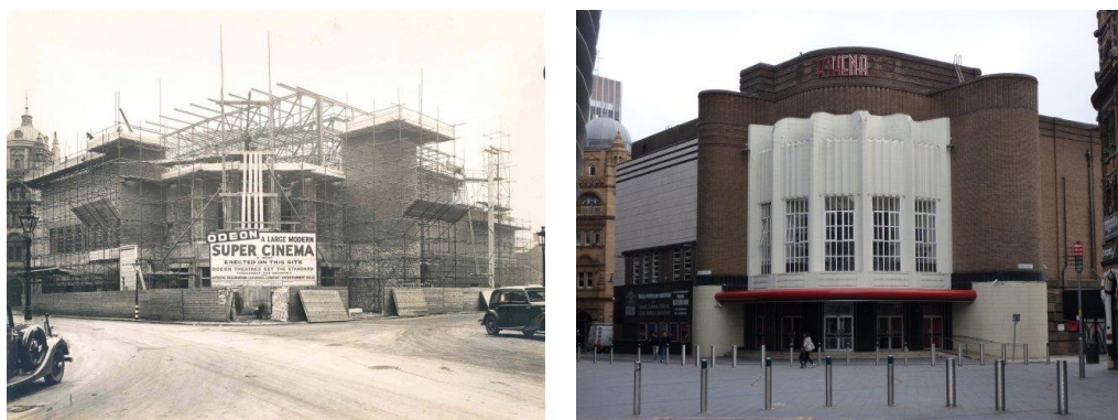
Figura 10. A la izquierda, los cines Odeon en construcción alrededor de 1940 y, a la derecha, el edificio reformado en la actualidad como la sala de celebraciones Athena.

El edificio en el que actualmente se aloja la sala de eventos y celebraciones Athena alojó, precedentemente, al Cine Odeon. Anteriormente, el sitio albergaba la fábrica de calcetería de Johnson and Barnes, formada en 1901 (Hulme, 2013). Diseñado por Robert Bullivant en 1938 como un “palacio de imágenes” Art Decó (Athena, 2022), tenía capacidad para albergar más de 3000 personas, siendo uno de los edificios más grandes y extravagantes de la región (Hulme, 2013). Estos cines se convirtieron en un espacio popular de Leicester, donde se proyectaban imágenes y se celebraban los eventos musicales más populares de la ciudad (Cultural Quarter Heritage, 2015), como el concierto de los Rollin Stones en 1964 (Dixon, 2013).