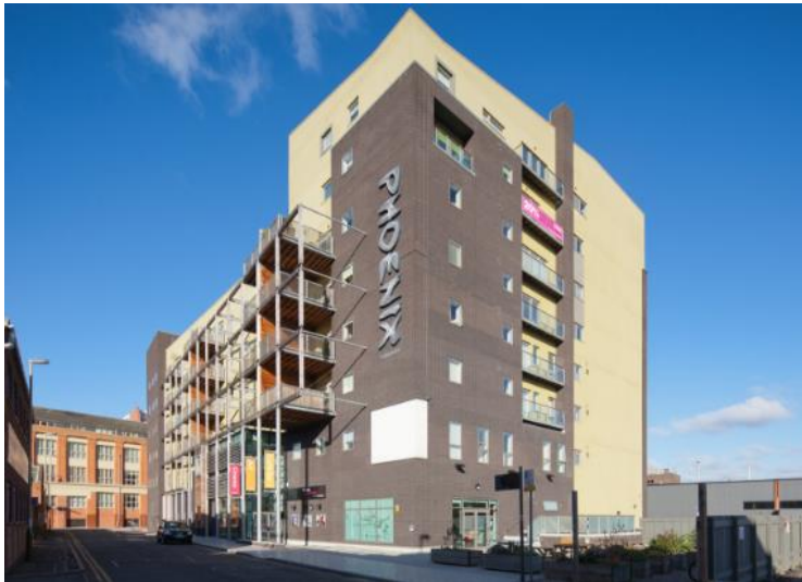
Figura 9. El Centro de Medios Digitales Phoenix Arts Center.

Actualmente, es una de las organizaciones culturales sin ánimos de lucro más populares de la ciudad. Ofrece un accesible programa de más de 350 películas diferentes cada año, exhibiciones de arte digital de nivel mundial, una amplia oferta de cine comunitario y servicios educativos para individuos, escuelas y estudiantes universitarios.