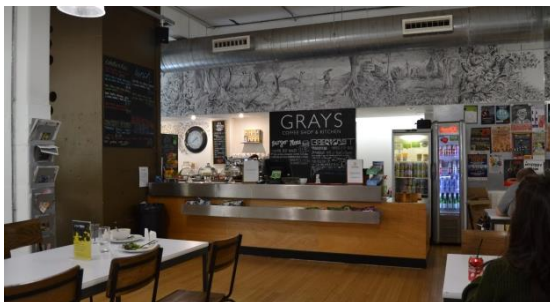
Figura 4. El café-bar Grays, en el interior del LCB Depot.