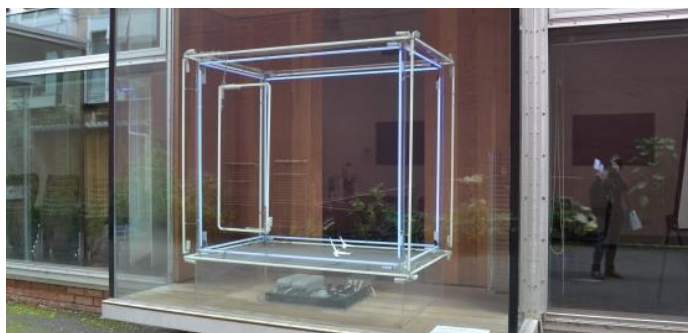
Figura 5. Espacio expositivo "Lightbox" en el LCB Depot.