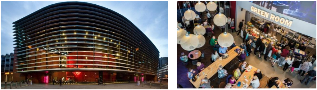
Figura 8. La fachada del Teatro Curve y el Green Room.

Para “llegar al público más amplio posible, permanecer abiertos e inclusivos y garantizar que cualquier persona, independientemente de sus circunstancias físicas, sociales, educativas o financieras, pueda involucrarse con las artes” (Curve, 2022), el teatro programa (Curve, 2022):