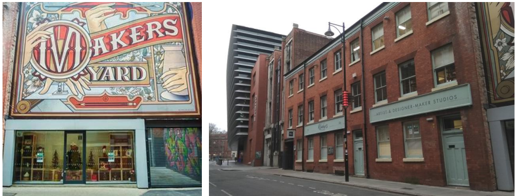
Figura 6. La antigua fábrica de J. Brown and Sons remodelada por el Ayuntamiento de Leicester como Makers’ Yard en 2012. Al fondo, puede verse el Curve y, justo al lado de la fábrica, el edificio Pfister y Vogel.

Siguiendo la remodelación del LCB Depot, surgieron otros proyectos, como la rehabilitación del edificio art decó del Cine Odeon en Rutland Street y la apertura del Teatro Curve en 2008; el Centro de Medios Digitales Phoenix, en 2009 y la de numerosos pubs, restaurantes, oficinas y viviendas en otros edificios de los siglos XIX y XX del distrito (LCB Depot, 2015).