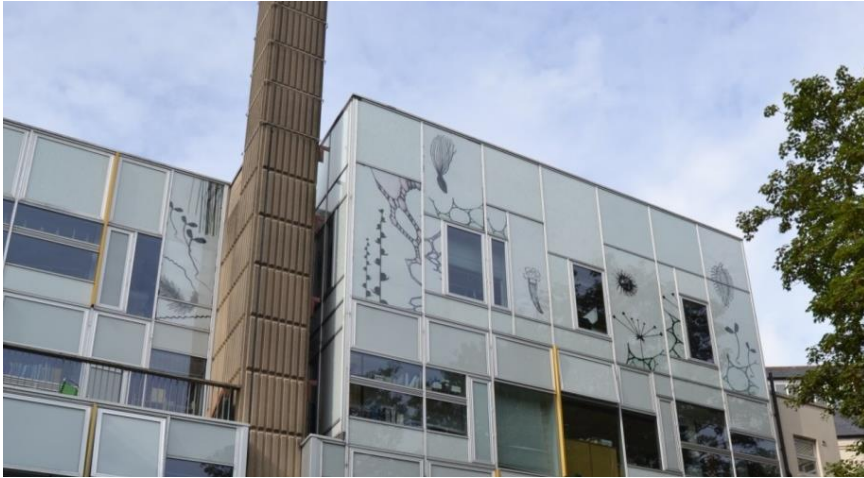
Figura 3. Fragmento de la obra “Seed Garden” realizada por Linda Schwab en la fachada posterior del LCB Depot.

te considerar que ya en el 2014 albergaba 367 industrias creativas, de las que el 95% se habían asentado en el edificio en el 2009 (LCB Development, 2014).