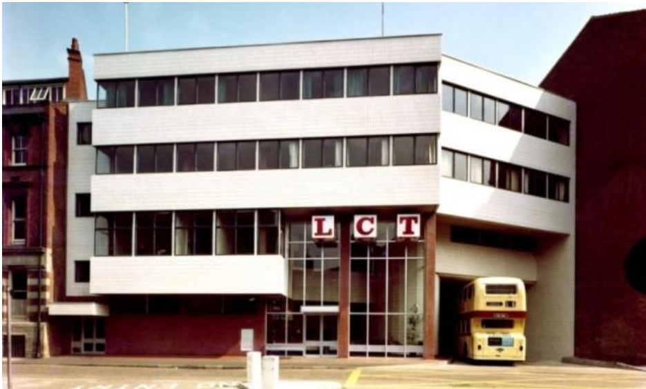
Figura 2. Imagen del LCT Depot en los años 70.

El proyecto de reconversión consistió en restaurar las antiguas oficinas agregando una nueva estructura en ladrillos de seis pisos y remodelando la fachada principal con ladrillos vistos de color rojizo, remplazando así los azulejos blancos originales que tanto chocaban con la estética de la zona. De esta manera, se pretendió que el edificio se asemejara más a los colindantes, aunque, como muestra de respeto al pasado, el color blanco pasó a protagonizar las fachadas interiores del edificio (Ash Sakula Architects, 2004).