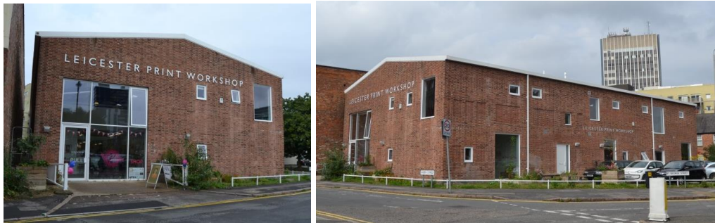
Figura 7. Leicester Print Workshop celebrando su 30 aniversario en 2016.