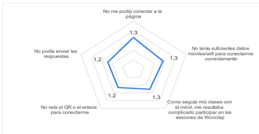
Gráfico 1. Gráfico radial de valores medios por dificultades

Dentro del análisis las dificultades del m-learning en las aulas, se observa que las incidencias sobre la aplicación son muy bajas. El valor promedio otorgado a todas las posibles incidencias es de 1,3, es decir, prácticamente “nunca”. Además, la frecuencia “nunca” es el valor más repetido en todas las posibles incidencias, lo que confirma que la herramienta Wooclap no presenta dificultades para seguir las clases.