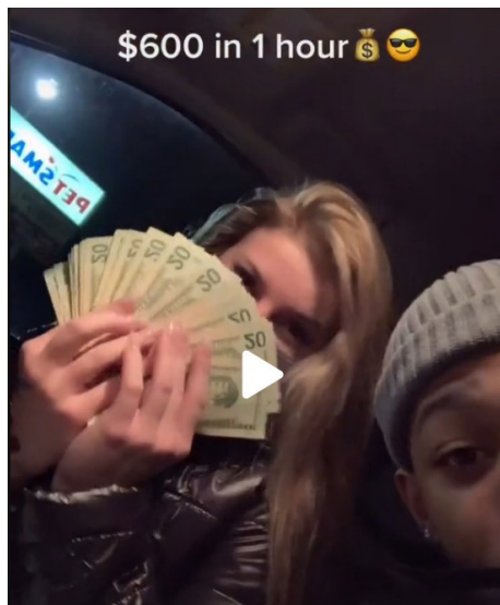
Imagen del vídeo de la chica con su novio tras ganar 600$ por pasar una hora con un sugar daddy .

La mayoría de los vídeos no muestran emociones. Son descriptivos y están centrados en detallar el dinero, los productos que logran y el nivel de vida que disfrutan, sin exponer las posibles contrapartidas de mantener este tipo de relaciones utilitarias. En el 80% de los vídeos (n=104) se muestra su relación sin manifestar ningún tipo de afección o emotividad para con el otro o con respecto a su relación. Las emociones negativas se plasman en los vídeos de humor que presentan alguna crítica, en los que se percibe desprecio, desagrado y desinterés.