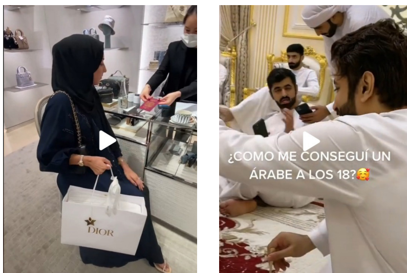
Imágenes de vídeos etiquetados con #sugardaddy en TikTok.

En el caso de los vídeos cuya vestimenta conduce a pensar que su procedencia es árabe la ropa tampoco resulta concluyente puesto que tanto ellas como ellos llevan abayas que no definen sus cuerpos. En el caso de ellos las llevan blancas y en el de ellas de colores como rojo o azul.