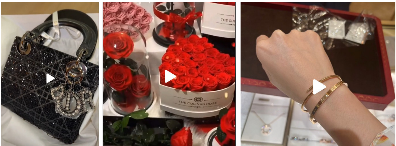
Imágenes de las producciones audiovisuales etiquetadas con el hashtag #sugardaady. Muestran los bienes materiales que obtienen gracias a sus relaciones transaccionales con sugar daddies .

Los intereses y actitudes expresadas por los/as tiktokers confirman la existencia de la sumisión a través de la manifestación continuada de las prerrogativas que obtienen de las relaciones con hombres mayores, llegando a mostrar, en algunos casos, la felicidad que le supondrá disfrutar de los bienes tras el deceso del sugar daddy . La escenificación tradicional femenina se relaciona con elementos de moda, bolsos, joyas y flores. Se refuerzan los roles de género a través de la imagen estereotipada de los sugar daddy como protectores, seguros, cariñosos y proveedores de los recursos materiales, mientras que los/as jóvenes publican su sometimiento y promocionan sin pudor su vinculación sentimental basada en lo material.