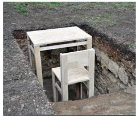
Figura 8. Oratoria NMAC 2015