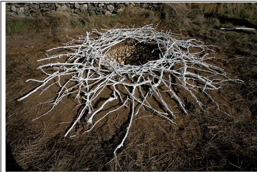
Figura 1. Imagen de la obra Nido , Paisajes Paralelos, Valdesimonte, Segovia.

Paisajes paralelos es el título de esta experiencia que supuso el primer contacto del trabajo de escultura y la naturaleza. Asociamos las obras artísticas a las tareas del campo, con sus herramientas (palas, azadones, rastrillos, carretillas) con sus modos de abordar la tierra, con sus gestos. Con ese afán que cada labriego pone en su tierra. Todas las intervenciones artísticas se hicieron a modo de cultivos, abriendo la tierra, moviéndola, cubriendo con ella más tierra. En ese mismo espacio del huerto se realizaron siete propuestas relacionadas con el mundo animal (habitar la tierra), vegetal y humano. De la calidad de los trabajos dan cuenta las imágenes 1 y 2 (Nido, Conversación con la tierra).