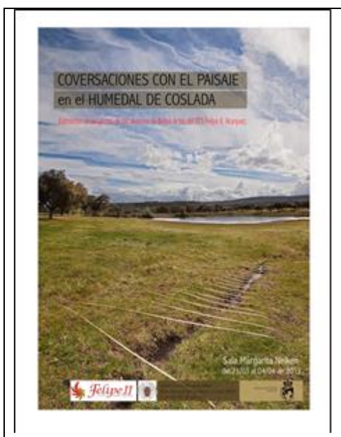
Figura 6. Cartel de la exposición de proyectos. Coslada

Los trabajos de los estudiantes fueron muy cuidadosos con el entorno; en unos casos emplearon materiales de desecho, en otros, materiales poco invasivos, y delicados. Mientras ellos te proponen la luna, nosotros te proponemos la tierra; Observatorio; Mar seco; Descanso en paz o Campo de crisálidas, son algunos de los títulos de sus propuestas. El contacto directo con ese espacio lleno de conflicto, se hace muy explícito en este tipo de intervenciones, muy sutiles, más de fusión que de dominación y muy poéticas en algún caso.