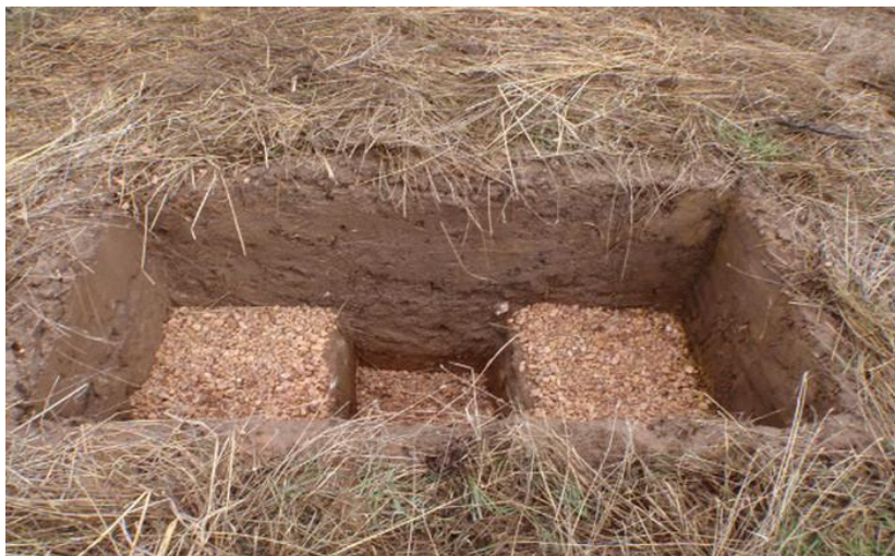
Figura 2. Imagen de la obra Conversación con la tierra , Paisajes Paralelos, Valdesimonte, Segovia.