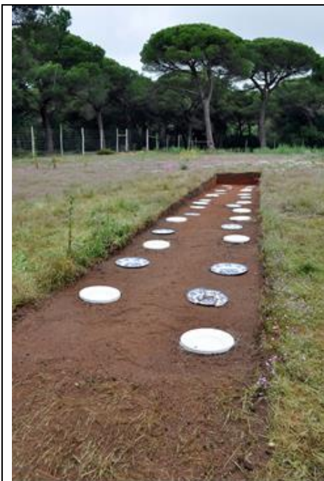
Figura 7. Banquete, mesa excavada en la tierra. NMAC.

Las obras que los alumnos y el equipo de profesores llevaron a cabo interpelan a la condición fronteriza del lugar, en algunos casos la dieron con sus obras un valor político y geográfico (Salem), en otros casos, reivindican el enriquecimiento de la mezcla de culturas, (Integrados), otras actuaciones se atienen a poéticas más tradicionalmente específicas del trabajo con la Naturaleza, como El sonido de la Tierra. Algunas apuntaban a contenidos más dramáticos, sin dejar de lado los elementos territoriales como la obra Banquete o Escapada. Como resultado de esta intervención tenemos una visión artístico-estética del espacio natural y otra artístico-crítica del espacio territorial.