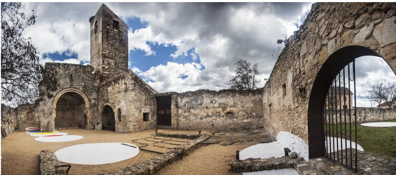
Figura 11. Vista de la intervención. Iglesia Santa María de Pedraza.

derruida. Se dibujaron los círculos y elipses correspondientes desde las 8 de la mañana hasta el mediodía, cuando la proyección era casi vertical. Para reforzar la idea de escultura, esas formas se rellenaron con mármol triturado de Macael que proporcionaba muchísima luz y con piedras trituradas teñidas de color. La escultura se iba ciñendo a la iglesia a medida que avanzaba el día, otorgando mucho movimiento a aquel espacio. La idea de conectar el cielo, a través de la bóveda desgajada con la tierra, hacía el trabajo mucho más abstracto y simbólico de lo que había sido hasta ahora. Habíamos pasado de conversar con el paisaje a trabajar la idea de lo sagrado. Aquí hay un contacto como nunca antes había tenido el proyecto con la arquitectura. Escultura y arquitectura en el paisaje. Fue la segunda ocasión en que los alumnos trabajaron en una idea común propuesta por los directores del proyecto, y no en sus propias propuestas. Su labor fue la de asistirnos y participar en una práctica real. Y como si de una sesión de rodaje se tratara, todo el equipo tenía claro el trabajo que había que sacar adelante.