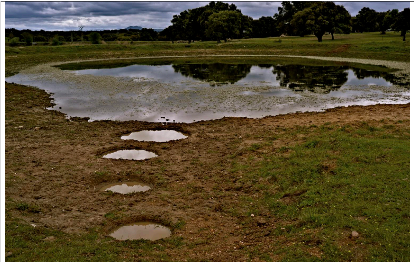
Figura 4. Depositar el agua, conversación por la tierra.

“desde el atlas geográfico recortado y manipulado por el joven Rimbaud a los mapas psicoanalíticos que Kuitka dibuja sobre colchones (pasando por el célebre mapamundi adaptado al surrealismo, el Atlas de Marcel Broodthaers y tantos otros) el arte moderno ha utilizado esta emblemática producción de la ciencia geográfica para generar desde ella desplazamientos de la idea de mundo, en tanto territorio físico y al tiempo imaginado.” 11