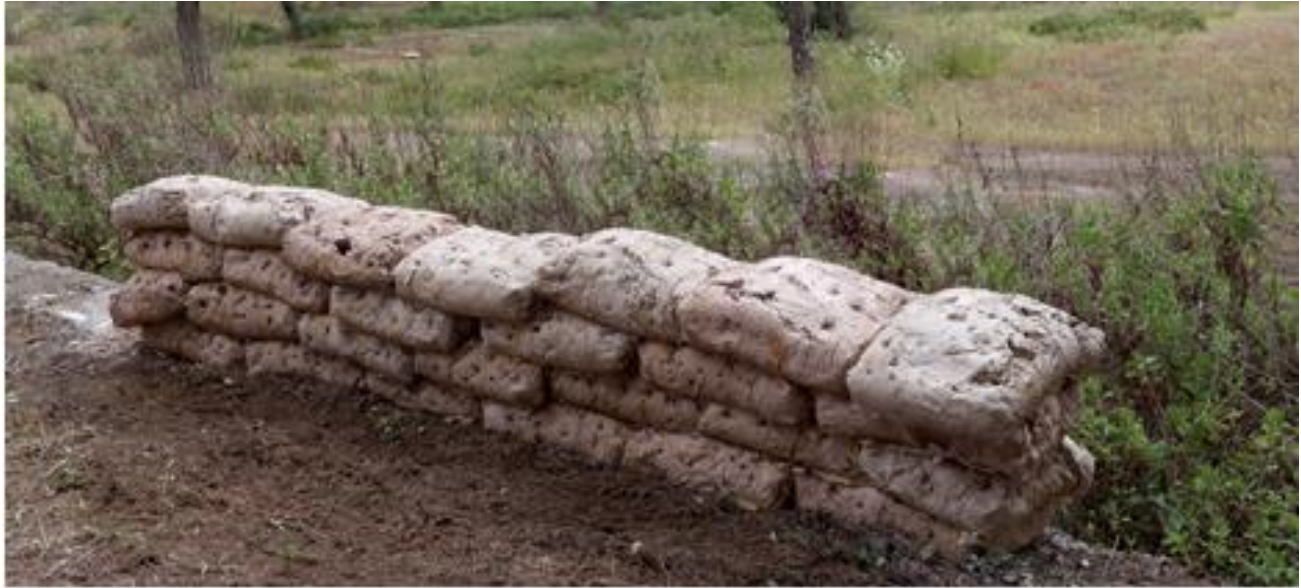
Figura 10. Tierra de nadie.

Admitida la complejidad con la que hoy es inevitable considerar el término paisaje, la noción clave de nuestra aproximación actual es emoción. El carácter emocional de una experiencia, concretamente de una experiencia estética, no deriva de la creencia ni la convicción positiva previa hacia ella, sino de su capacidad para (con) mover arrastrando sin cortapisas al espíritu hacia el objeto propuesto y congelando momentáneamente el análisis que equilibra distancias con el sujeto.