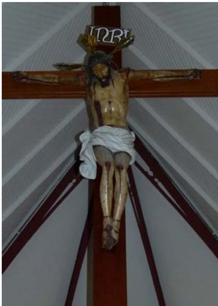
Fig.1. Crucificado (general); Martín Alonso de Mesa; Ca. 1603; imagen en madera; tamaño natural; Catedral de San Marcos de Arica (Chile).