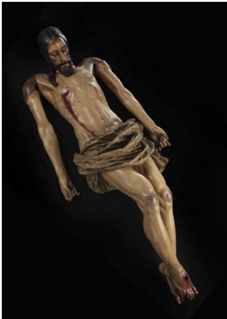
Fig.3. Cristo del Descendimiento; Pedro de Noguera; 1619; imagen en madera; tamaño natural; Capilla de la Soledad (Lima).