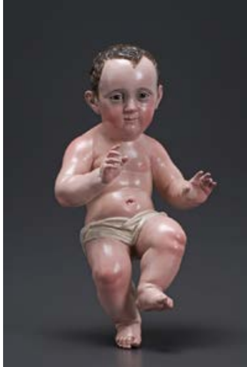
Fig.8. Niño Dios “doctorcito”; influencia sevillana. XVII; imagen en madera; 30x16x12 cm. Museo de Artes Universidad de los Andes; Santiago de Chile.