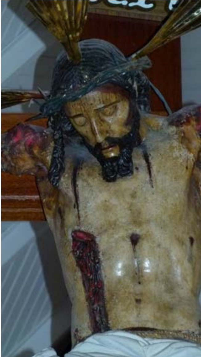
Fig.2. Crucificado (detalle del torso); Martín Alonso de Mesa; Ca. 1603; Catedral de San Marcos de Arica (Chile). © Magdalena Percira.