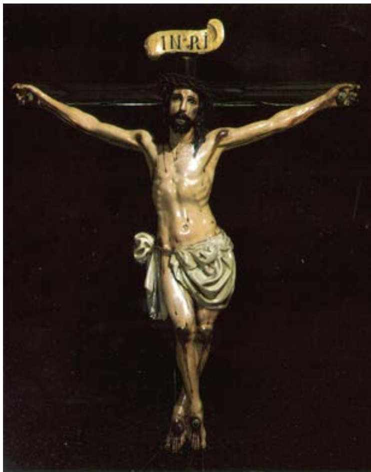
Fig.5. Cristo de la Conquista (general); escuela sevillana ¿?; 1º tercio del sig. XVII; imagen en madera; 120 cm.; de altura x 110 cm. de ancho. Iglesia de la Merced; Lima (Perú).