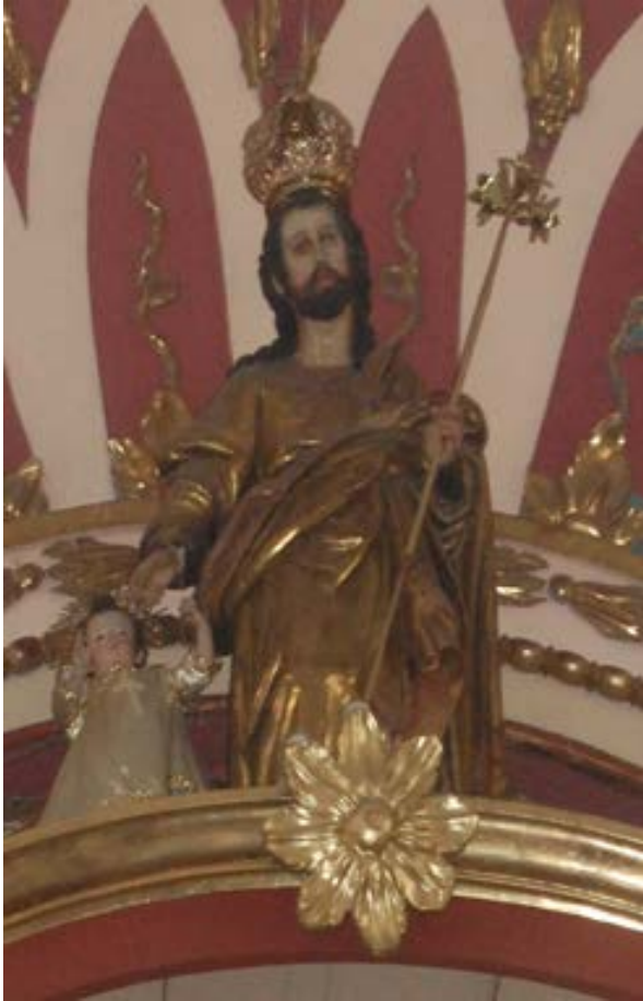
Fig.10. San José; escuela sevillana ¿?; 1º tercio del sig. XVII; imagen en madera; iglesia del Carmen de Barrios Altos. Lima.