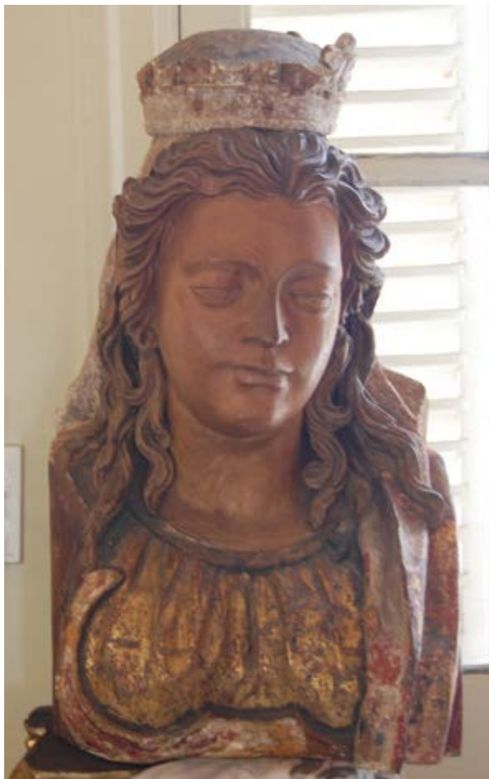
Fig.11. Busto femenino; escuela sevillana ¿?; 1º tercio del sig. XVII; imagen en madera. Museo Pedro de Osma de Lima.