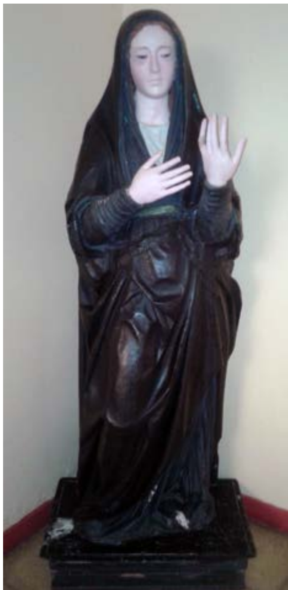
Fig.7. Inmaculada. Anónimo sevillano; ppios s. XVII; Catedral de San Marcos de Arica (Chile).