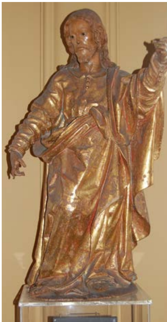
Fig.9. San José; escuela sevillana; 1º tercio del sig. XVII; imagen en madera; 97 cm. de alto por 52 cm. de ancho.