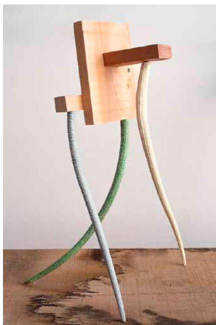
Figura 4: C.V.F. Poliuretano pintado y madera. 40x36x30 cm. Fotografía Valerie de la Dehesa, 2023