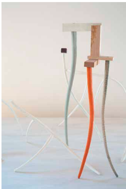
Figura 3: C.V.LL. Poliuretano pintado y madera. Fotografía Valerie de la Dehesa, 2023.