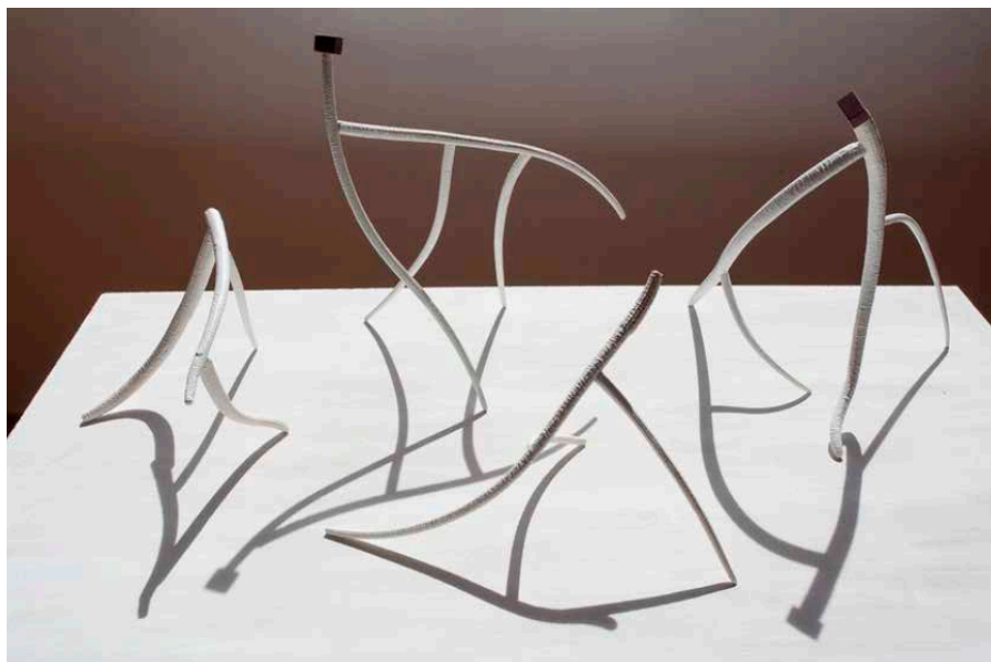
Figura 2: C.V.A, C.V.B, C.V.C, C.V.D. Poliuretano pintado y madera, Instalación. Fotografía Valerie de la Dehesa, 2023.

Pertenecían a un lugar, fijando la vida en él. Al separarse del suelo, pertenecen a otro plano: siguen teniendo la esencia y el movimiento de la planta viva, pero han crecido en animalidad o humanidad. Parecen seres que celebran la vida al aire libre.