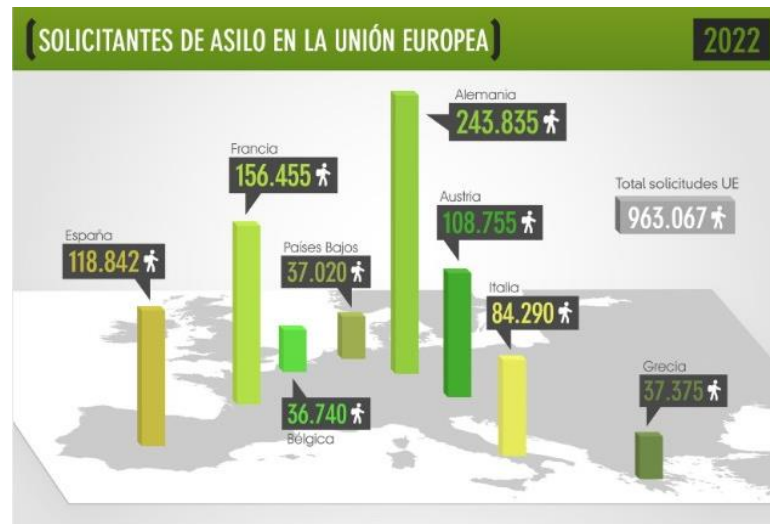
Imagen 6. Gráfico de datos.

En el contexto de la Unión Europea, la tasa de reconocimiento de la protección internacional alcanzó el 38.5% en 2022, lo que representa un aumento de tres puntos porcentuales en comparación con 2021 y marca el nivel más alto en cinco años. 74