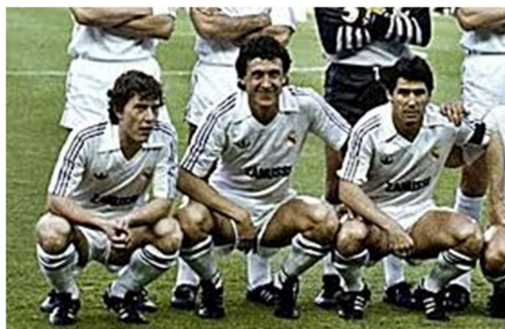
Imagen 4: Emilio Butragueño, Hugo Sánchez y Michel

Durante los años 80 y 90, bajo la presidencia de Santiago Bernabéu, el club experimentó otra etapa dorada. Dominada por una generación de jugadores con mucho futuro. La “Quinta Del Buitre” jugadores liderados por Emilio Butragueño y Hugo Sánchez y Michel. El equipo además de ganar varias Ligas españolas, terminaron su sequía de 32 años y ganaron su séptima Copa de Europa en 1998, consolidando su estatus como uno de los mejores clubes del mundo.