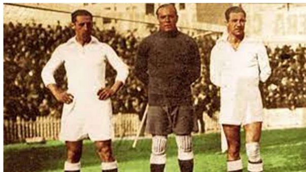
Imagen 1: Ciriaco, Zamora y Quincoces

En los años 20, el Real Madrid comenzó a tener prestigio a nivel internacional y empezaron a fichar a los mejores jugadores en ese momento como el portero Zamora 2 y los defensas Quincoces y Ciriaco, llegando a formar en aquellos años, la mejor defensa del mundo.