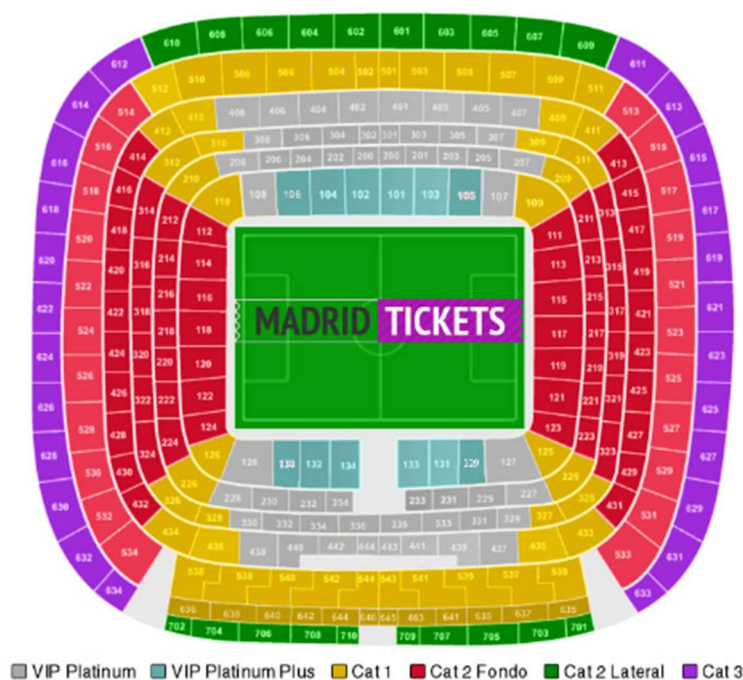
Imagen 10: Sectores Santiago Bernabéu