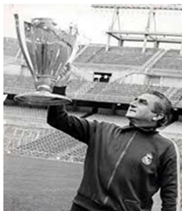
Imagen 3: Miguel Muñoz con la Copa De Europa

Los dueños del periódico francés L'Equipe, formaron una comisión con Santiago Bernabéu como uno de los vicepresidentes. En 1956 se celebró el primer Campeonato, dando su origen a la Copa de Europa.