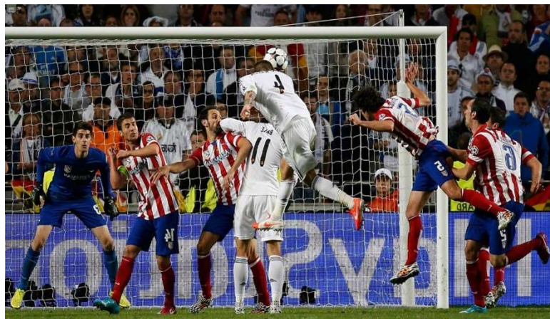
Imagen 7: Gol de Sergio Ramos en la final de 2014 contra el Atlético De Madrid

Bajo la dirección de entrenadores como Carlo Ancelotti, Zinedine Zidane y José Mourinho, el Real Madrid continuó cosechando éxitos en la década de 2010. Durante estos años destacan las Copas de Europa conseguidas en 2014, 2016, 2017 y 2018. Con uno de los momentos