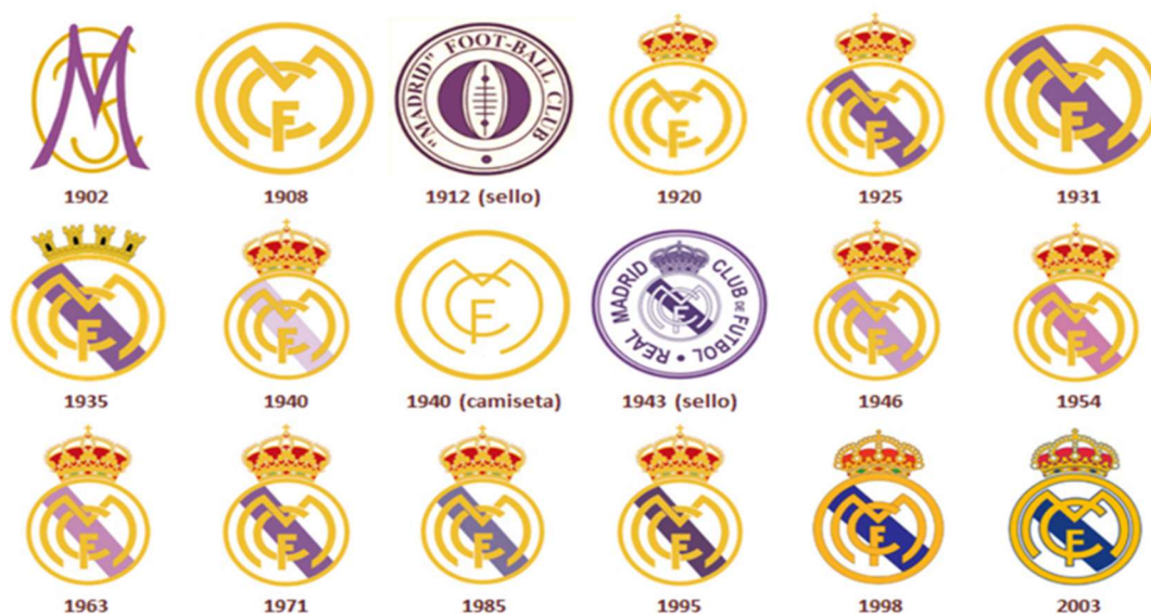
Imagen 8: Orden cronológico del escudo del Real Madrid Club de Fútbol desde su creación