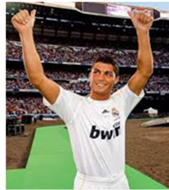
Imagen 6: Presentación de Cristiano Ronaldo en 2009

Durante estos años además de ganar la Copas de Europa en 2002, también ganó dos ligas más en 2007 y 2008. Sin embargo, tras la desastrosa temporada de 2009, Florentino Pérez regresó como presidente para intentar recuperar el ánimo de la afición del Real Madrid y fortalecer el club. Una de sus acciones fue fichar al talentoso jugador portugués de la liga inglesa que había impresionado al mundo entero, Cristiano Ronaldo, convirtiéndose en el fichaje más caro del mundo en aquel momento, 90 millones de euros. Además de jugadores como Karim Benzema, Gareth Bale, Toni Kroos o Luka Modric.