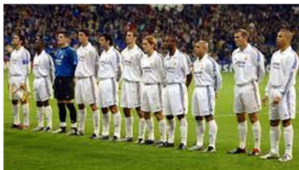
Imagen 5: Equipo del año 2002 del Real Madrid Club de Fútbol

Entrando en el siglo XXI, Florentino Pérez llegó a la presidencia y el Real Madrid adoptó la política de fichar a jugadores de renombre mundial, conocidos como los “Galácticos”. Grandes nombres como Zinedine Zidane, Luís Figo, Ronaldo Nazário formaron parte de este período. Acompañados por el canterano Raúl y leyendas como Hierro, Roberto Carlos o Redondo.