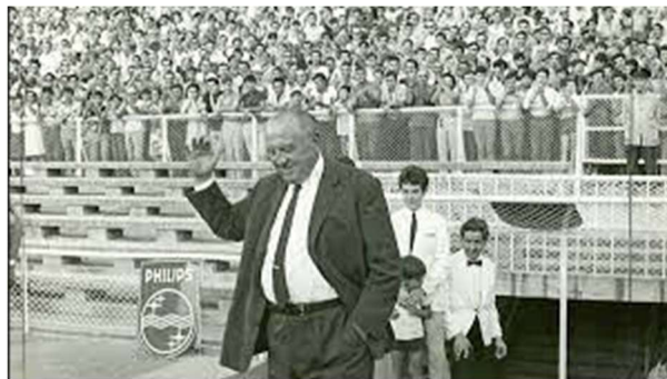
Imagen 2: Santiago Bernabéu nombrado presidente del club

Después de la Guerra Civil 3 y la Segunda Guerra Mundial 4 , para poder levantar cabeza, nombraron a Santiago Bernabéu como presidente del club y sumado a la construcción del nuevo estadio de fútbol, se vendría una de las mejores épocas de su historia.