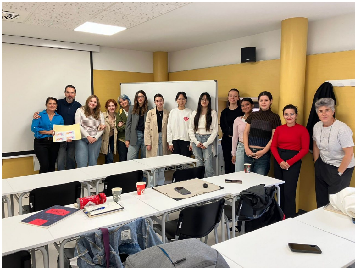
Fotografía de los asistentes al Seminario-Workshop

Director del Seminario-Workshop Dibujo urbano del natural aplicado al mobiliario urbano