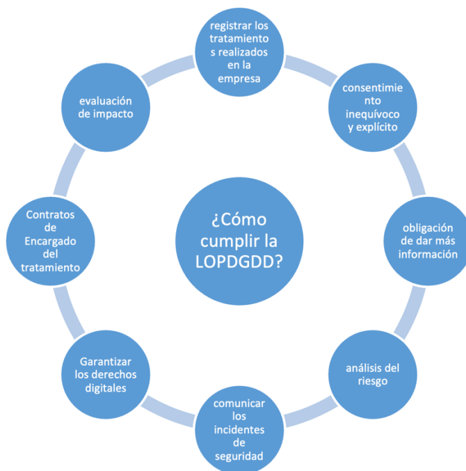
Ilustración 2: Cumplimiento óptimo de la LOPDGDD