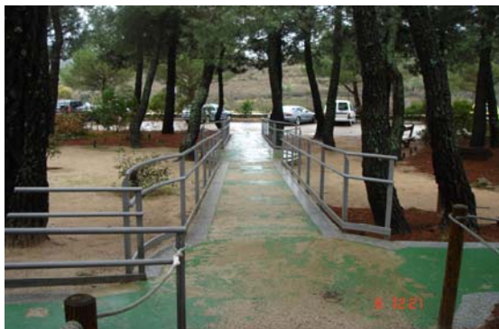
Fotografía 3: Acceso al CEA Manzanares (Manzanares El Real, PRCAM)