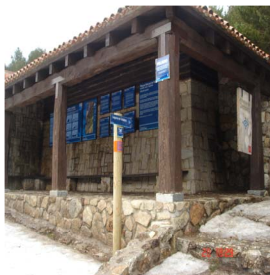
Fotografía 10: Mirador “El Cobertizo de Lucío” (Parque Natural de Peñalara)

Existen, además, carencias en lo que se refiere a la señalización e información disponible en dichos equipamientos puesto que ninguno de los miradores analizados dispone de información en braille, aunque al menos dos de ellos si que tienen paneles informativos visuales.