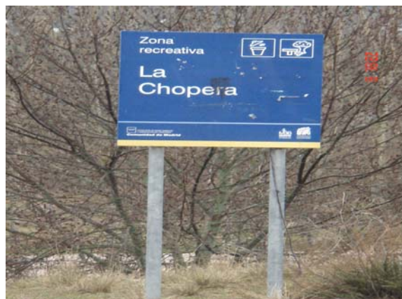
Fotografía 2: Panel informativo del área de recreo "La Chopera" (PRCAM)