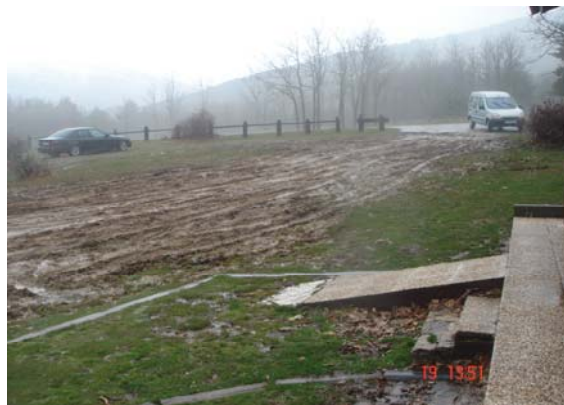
Fotografía 7: Aparcamiento del área de recreo “Mirador de los Robledos” (Parque Natural de Peñalara)

Además, hemos observado que las mesas y sillas que se encuentran en las diferentes áreas de recreo son principalmente de piedra o de madera. Ambas son fijas e inmóviles lo cual dificulta el acercamiento a éstas por parte de una persona en silla de ruedas. Así mismo, las mesas y sillas instaladas en las diferentes áreas de recreo no cuentan con las medidas mínimas establecidas para facilitar el acercamiento frontal por parte de una persona en silla de ruedas.