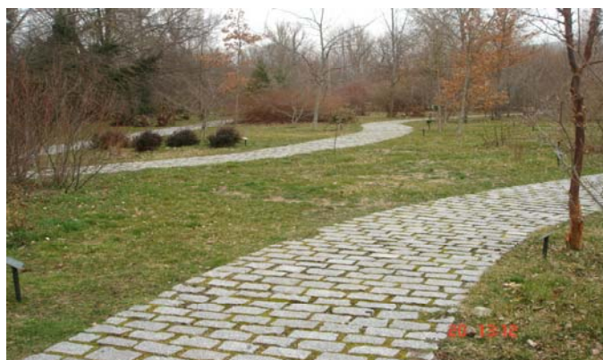
Fotografía 11: Perspectiva del Arboreto Giner de los Ríos (Parque Natural de Peñalara)

Todos los jardines analizados son accesibles al encontrarse situados al nivel del suelo y sin barreras arquitectónicas como escaleras o desniveles naturales. No obstante, hemos de señalar que, en el Jardín de Aromáticas, situado en el CEA Manzanares, sí existen varios escalones pequeños aunque, consideramos que, debido a su reducida altura, éstos no serían un obstáculo para ningún tipo de usuario.