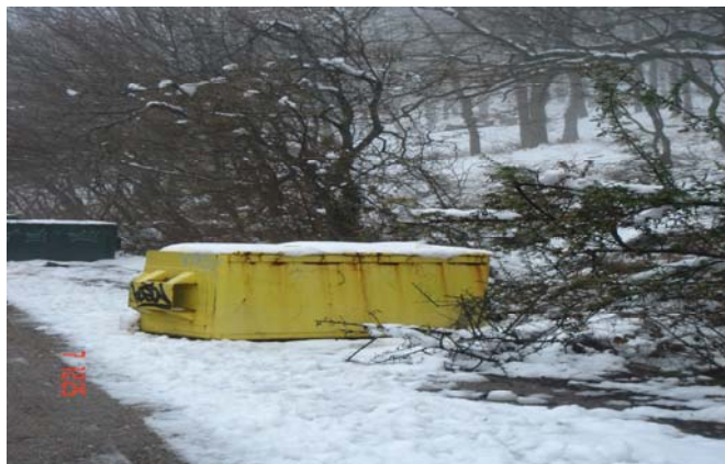
Fotografía 8: Papeleras instaladas en el área de recreo de “Las Dehesas” (PRCAM)

altura mayor a 1 metro pero la boca de las mismas está situada a más de 80 cm de altura del suelo. Igualmente, muchas de las papeleras disponen de una tapadera de gran peso en lugar de tener un orificio abierto que haga más sencillo el uso de éstas 29 .