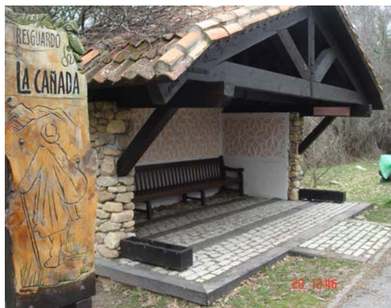
Fotografía 15: Zona de descanso en el mismo carril peatonal de la senda.

La ruta podría ampliarse ya que existen caminos próximos con dimensiones mayores a 1,20 metros, de tierra firme y con escasas barreras e impedimentos naturales o arquitectónicos.