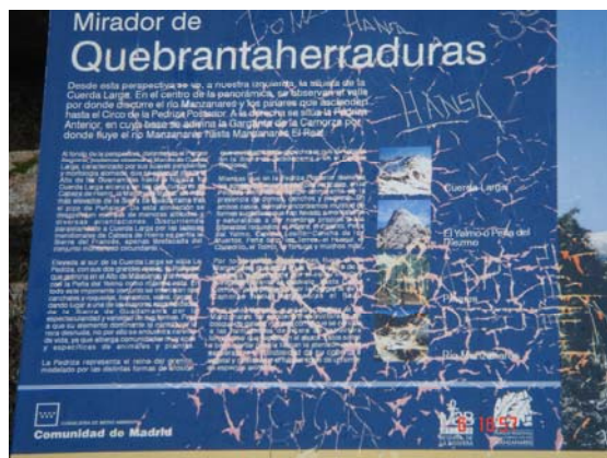
Fotografía 1: Panel informativo del Mirador de Quebrantaherraduras (PRCAM)

Finalmente, hemos de destacar que, en numerosas ocasiones, hemos pasado por alto ciertos equipamientos, mayoritariamente áreas de recreo, al no disponer de una señalización visible así como, al no indicarse con suficiente tiempo previo.