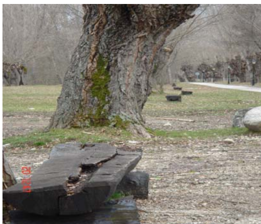
Fotografía 14: Bancos próximos y a lo largo de todo el carril peatonal.