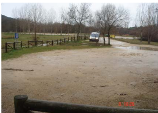
Fotografía 3: Aparcamiento del área de recreo “La Chopera” PRCAM.

En líneas generales, podemos decir que a pesar de que las áreas de recreo deberían ser los equipamientos mejor adaptados, son con diferencia los equipamientos con mayores carencias. Así, en primer lugar, encontramos que del total de las áreas valoradas, la mitad de éstas cuentan con un aparcamiento de tierra por lo que las lluvias, o el tráfico rodado, entre otros aspectos, favorece la formación de barro, charcos e incluso pequeñas lagunas que inhabilitan la circulación y dificultan el desplazamiento por el mismo. Además, al no estar asfaltados, no disponen de delimitación alguna en cuanto a las plazas de aparcamiento. De este modo, como es obvio, tampoco se ha señalado plaza de aparcamiento alguna para personas con discapacidad.