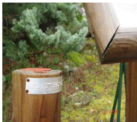
Fotografía 13: Indicaciones adaptadas del Jardín de Aromáticas (PRCAM)