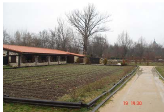
Fotografía 4: Exterior del CEA Puente del Perdón, (Rascafría, Parque Natural de Peñalara)

Aunque, si el acceso a dichas instalaciones es el adecuado, no lo son tanto, las condiciones del mostrador o recepción. Así, encontramos que ninguno de los CEA visitados dispone de un mostrador a dos alturas ni cuenta con las dimensiones mínimas para que una persona en silla de ruedas pueda acercarse frontalmente al mostrador 26 . Sin embargo, el total de los centros evaluados, sí cuenta con un espacio libre mínimo de 1,50 m. de diámetro que permite así realizar un giro de 360° a una persona en silla de ruedas.