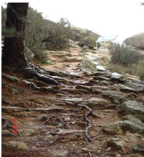
Fotografía 9: Subida al Mirador “Quebrantaherraduras” (PRCAM).

Con respecto a los miradores valorados podemos decir que de éstos únicamente uno de ellos dispone de aparcamiento próximo al equipamiento, mientras que los otros dos, a pesar de encontrarse cerca del Aparcamiento de Cotos (Parque Natural de Peñalara) requieren de una pequeña caminata, ascendiendo por la ladera de una montaña, que al menos durante los meses estivales no resulta accesible para nadie. Tampoco resulta accesible la subida al Mirador Quebrantaherraduras desde el aparcamiento del mismo equipamiento ya que la subida se realiza por una pendiente natural en la que no existen siquiera pasamanos. El aparcamiento, en cambio, sí está asfaltado aunque no dispone de delimitación alguna de las plazas al igual que no cuenta con ninguna plaza reservada para personas con discapacidad.