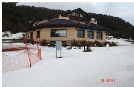
Fotografía 5: Exterior de la oficina de Información Casa de Cotos (Rascafría, Parque Natural de Peñalara)

De entre los espacios protegidos analizados, únicamente encontramos una oficina de información dentro del PRCAM. En este caso, el equipamiento cuenta con escaleras y rampa para acceder a la misma pero se encuentra en una zona con bastante pendiente donde, desde el parking, se hace necesario caminar unos 100 metros aproximadamente. Los propios informadores de la oficina nos explicaron que, en los meses estivales cuando no llueve, nieva, ni se crean placas de hielo, sí es posible acceder al equipamiento en silla de ruedas aunque, durante nuestra visita al espacio cuando todo estaba nevado, nosotros mismos comprobamos que el acceso resultaba complejo incluso para una persona en plena forma física. Por ello, creemos que la localización del mismo, resulta totalmente inaccesible para las personas con discapacidad, principalmente para las personas con discapacidad física.