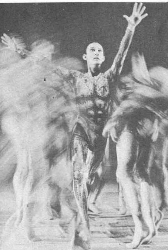
Teatro de Pantomima de Wrocław (Laberintos)