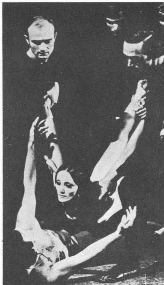
Ballet Nacional de los Países Bajos (Ivesiana).

Ivesiana: (mus.: Charles Ives. / cor.: George Balanchine.)