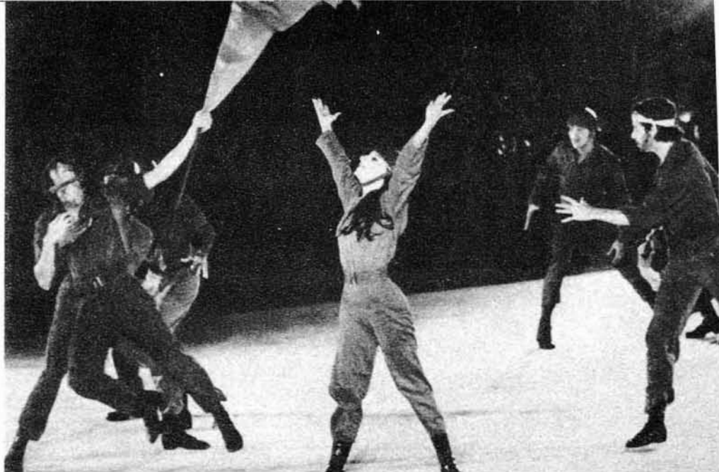
Escena de La avanzada , de Azari Plisetski, con Alicia Alonso. Ciudad Deportiva

en Cuba a finales de 1971, invitados por el Consejo Nacional de Cultura. Ileana Iliescu y Marin Stefanescu, primeras figuras del Teatro de Opera y Ballet de Bucarest, interpretaron números de concierto y el II acto de El lago de los cisnes acompañados por los elencos del Ballet Nacional de Cuba y el Ballet de Camagüey. Posteriormente, Adele Oroz y Victor Rona, estrellas del Teatro de Opera y Ballet de Budapest, ofrecieron al público habanero los pas de deux El pañuelo y Gayané, coreografías de Harangozo y Anisimova, respectivamente, así como dos funciones del ballet Giselle, secundados por el Ballet Nacional de Cuba.