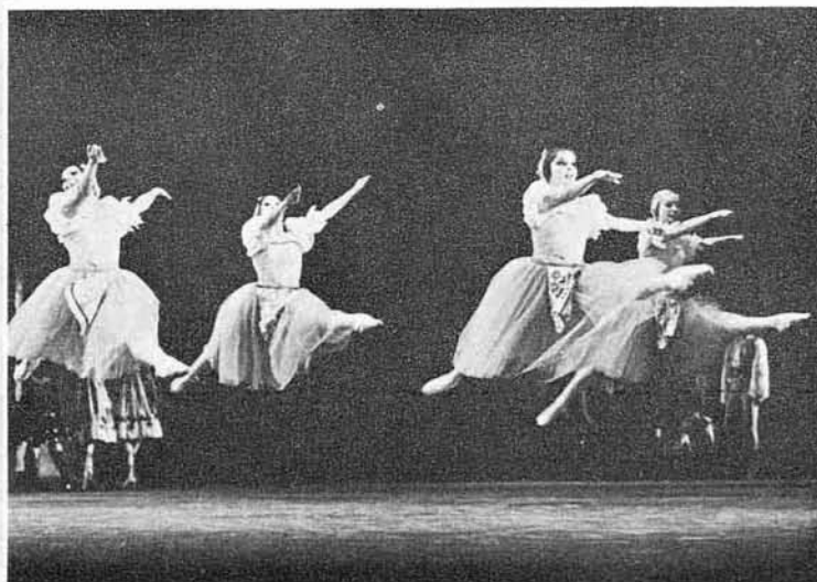
La Compañía Nacional de Danza de México en Coppélia . (Foto: Camargo, México D. F.).

Con gran éxito ha continuado desarrollándose el convenio de colaboración cultural suscrito entre los gobiernos de Cuba y México, mediante el cual el Ballet Nacional de Cuba y la Escuela Nacional de Ballet de Cubanacán brindan asesoramiento técnico y artístico a la Compañía Nacional de Danza y a las escuelas de esta especialidad, radicadas en el hermano país azteca. Bajo la dirección general de Alicia Alonso, han brindado su valioso aporte en los últimos meses dos equipos integrados el primero de ellos por el solista Raúl Bustabad y las bailarinas Denia Hernández y María Luisa López. Este equipo, además de impartir y tomar ensayos de las obras ya en repertorio, realizó el montaje del ballet La fille mal gardée , según la versión coreográfica de Alicia Alonso, e inició el de Imágenes , coreografía de Menia Martínez y Joaquín Banegas. Durante su estancia en México. Raúl Bustabad