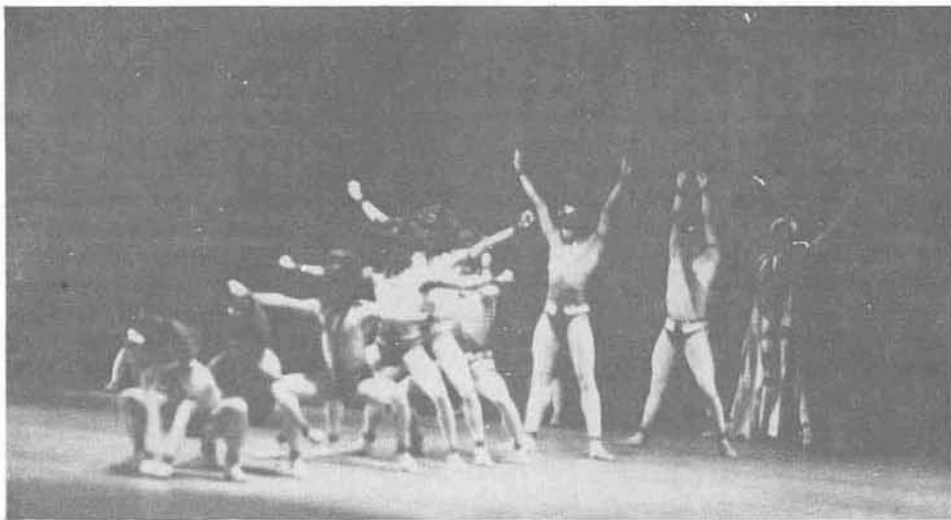
El Ballet de Camagüey en Sikanekue, de Herrera / Ramos.

Abajo: Cantata, de Tenorio / Orff.