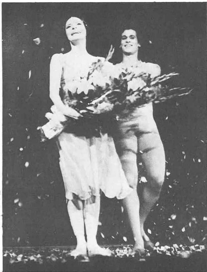
Alicia Alonso y Jorge Esquivel reciben la ovación del público limeño.