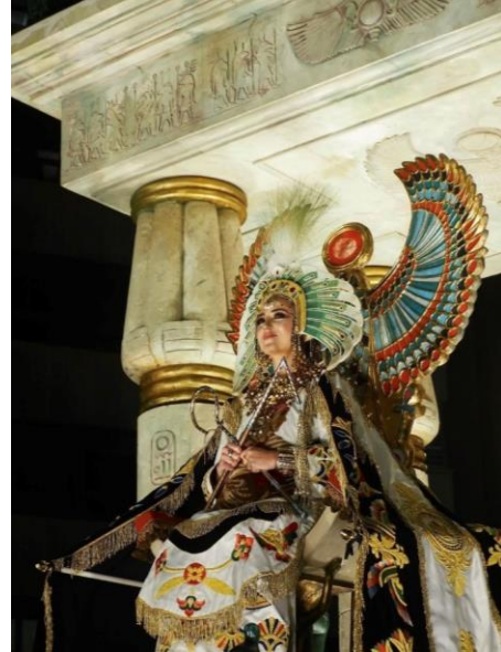
Fig. 5. Reina de Saba del Paso Blanco, 2024.

Actualmente, el grupo de La Reina de Saba, se enmarca en una gran carroza acompañada por sus esclavas, su corte a pie y caballería (formada por diez caballos), y una biga que es conducida por una persona que representa a Manelik, el hijo de la reina. Además de ser una de las imágenes más características del Paso Blanco, la reina de Saba porta uno de los atuendos más espectaculares y excéntricos de la Semana Santa de Lorca (fig. 5).