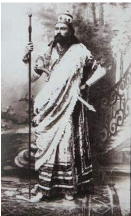
Fig. 6. Rey Nabucodonosor, procesiones de 1882.