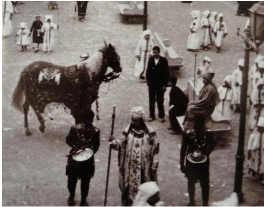
Fig. 12. Estreno del “Caballo del Respeto”.

ha estado cargado de simbolismo en la tradición cristiana, aquel asiento vuelve a ser una prefiguración del riquísimo trono del señor Jesucristo, lo que da sentido a su presencia en este desfile.