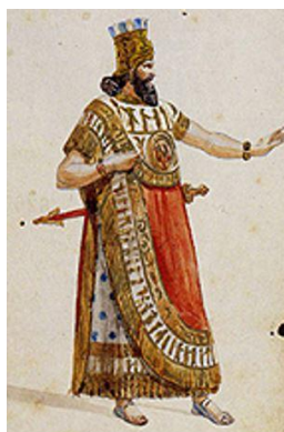
Fig. 33. Boceto del primer vestuario para la ópera de Nabucco .