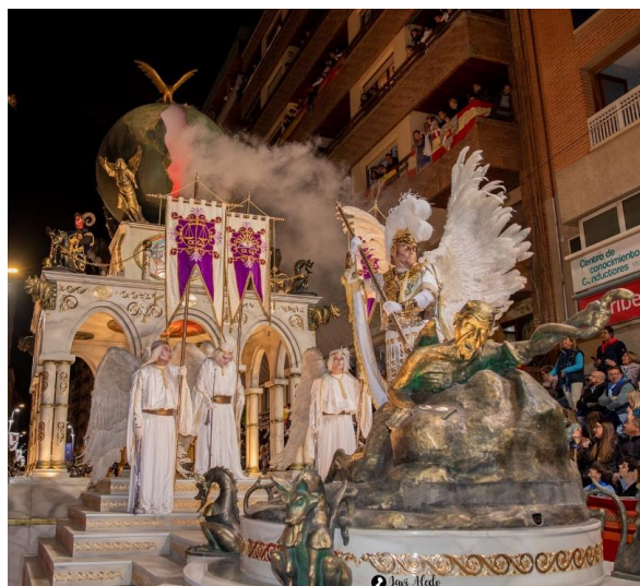
Fig. 15. Carroza de La Visión de San Juan, 2024.

El tema de la visión del Apocalipsis es representado actualmente por el grupo procesional de La Visión de San Juan, el cual va acompañado de su correspondiente caballería y del grupo “Los Cuatro Jinetes del Apocalipsis” (figs. 16 - 17).