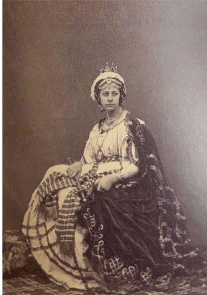
Fig. 4. Antigua reina de Saba del Paso Blanco, alrededor del 1867.

La Reina de Saba en su visita a Salomón ha sido uno de los grupos que la Semana Santa de Lorca mantiene desde sus orígenes (fig. 4). A pesar de haber utilizado puestas en escena diferentes, la reina de Saba se ha representado siempre en el mismo pasaje.