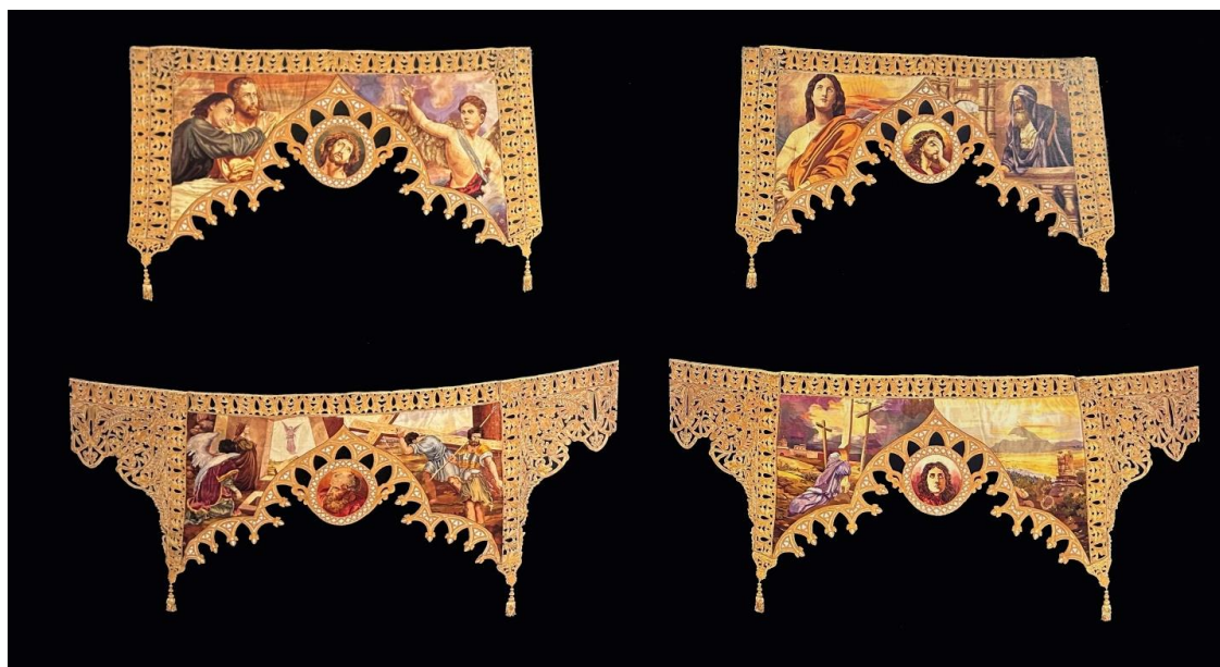
Fig. 25. Palio del trono de la Virgen de la Amargura, 1943.

duciendo con fidelidad el cuadro El ángel de la eucaristía (1769) de Giambattista Tiepolo. En lo alto, un querubín bajo un sol radiante simboliza iconográficamente a Dios Padre, agregando una dimensión celestial a la composición. Además, el bordado en oro que adorna las cenefas con motivos de filiación gótica realza la majestuosidad del conjunto, evidenciando el cuidado de la técnica 33 .