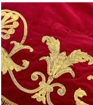
Fig. 36. Manto remendado y estropeado durante algunos años dispuesto a ser restaurado, 2024.

La comisión artística se encarga de idear nuevas propuestas para la procesión y renovar aquellos bordados que, con el paso de los años, se han ido deteriorando (fig. 36). Para ello, se siguen una serie de pautas en orden cronológico, comenzando por la composición de la obra.