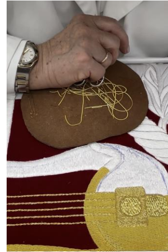
Fig. 42. Paso 3 bordado en oro; canutillo enladrillado al hilo del resto, 2024.

A partir del siglo XX el bordado en oro pasaría a un segundo plano y predominaría el uso del bordado en seda. A pesar de ello, en la actualidad, el bordado en seda y el bordado en oro conviven en todas las composiciones.