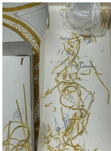
Fig. 39. Detalle del canutillo en espiral empleado en el bordado de oro en realce, 2024.

En el caso del bordado en oro, se empieza aplicando una base de algodón en rama que va moldeándose según la forma que el boceto nos indique y que vayamos a plasmar. En función de si queremos que el bordado tenga más o menos realce, se modula la cantidad de algodón que se pone en la base. El algodón se asegura al tejido mediante una serie de puntadas con hilo del mismo material en vertical u horizontal, siempre en dirección contraria a la que se va a bordar; es decir, si se va a bordar en vertical se sujeta con puntadas en horizontal y viceversa. Encima del algodón, mediante aguja, dedal y un hilo encerado que facilita la adherencia del canutillo, se empieza a elaborar el proceso. Para ello, se corta un trozo de canutillo de la misma medida que se necesita y se introduce la aguja de abajo hacia arriba por el bastidor (fig. 40); por último, se mete la punta de la aguja en el hueco del canutillo y esta se clava de abajo hacia arriba (fig. 41) quedando finalmente el canutillo enladrillado (fig. 42). Para evitar que estos no se mueven se le suele dar una puntada de sujeción.