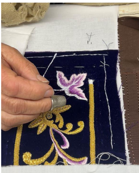
Fig. 48. Detalle bordado en seda, túnica del Paso Blanco, 2024.

La tela dispuesta a ser bordada se traspasa alternativamente desde arriba hacia abajo y desde abajo hacia arriba por una fina aguja que fija los hilos de seda de colores, y con la que se dan las puntadas con arreglo a un modelo ya preconcebido por el director del bordado 63 .