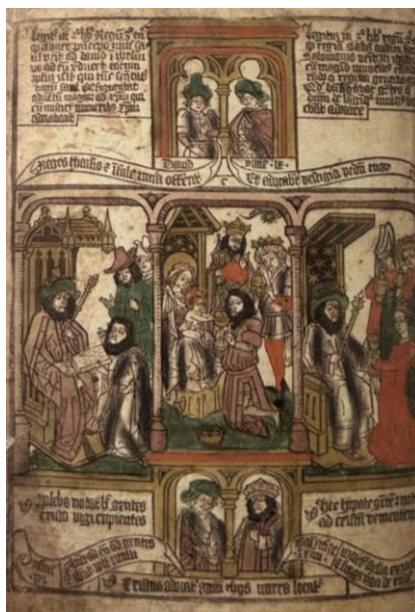
Fig. 32. Ilustración de la Biblia Pauperum , En el centro una representación de la Epifanía; a la derecha la visita de la reina de Saba a Salomón.

Por otro lado, es importante mencionar otra de las inspiraciones que sirvió y sirve hoy de influencia en la escenografía y atrezzo de las procesiones; pues a finales del siglo XIX, la procesión se adentra en un mundo onírico guiándose por referencias extraídas del mundo de la ópera con ejemplos tan significativos como Nabucco (1842) o Aida (1871) de Giuseppe Verdi (fig. 33). Obras como estas fueron dadas a conocer por revistas culturales a las que la ciudad de Lorca, ya empezaba a tener acceso 49 . De este modo, se puede explicar la teatral y ostentosa puesta en escena de los desfiles bíblicos pasionales (fig. 34).