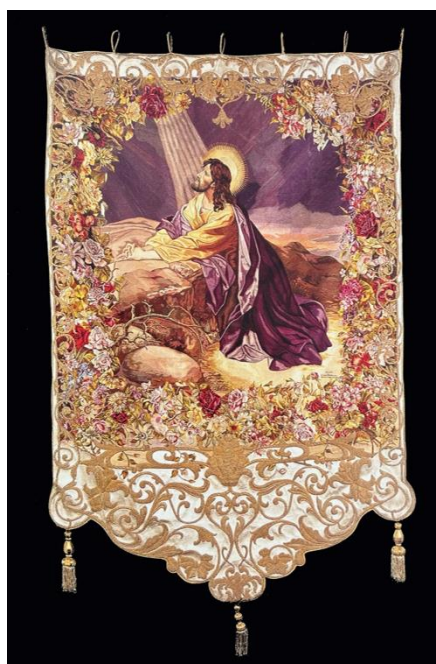
Fig. 27. Estandarte de La Oración en el Huerto también conocido como Paño de las Flores, 1918.