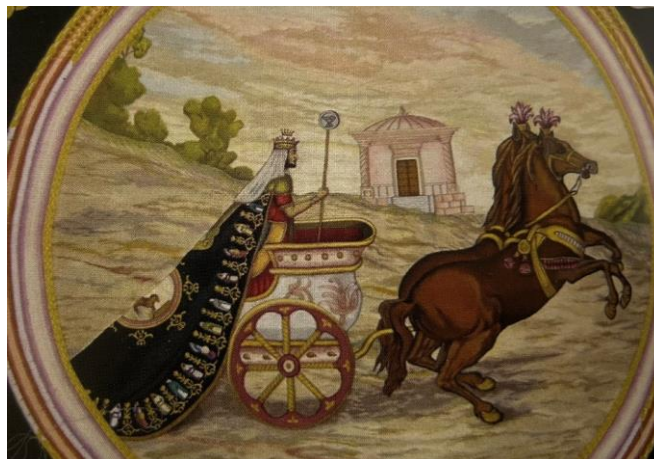
Fig. 11. Detalle de la imagen central del manto de Salomón. Al fondo vemos el templo de Jerusalén.

Salomón en la construcción del templo de Jerusalén fue estrenado entre 1885 y 1890 17 . Para entender y justificar la presencia de este personaje en las procesiones, más que analizarlo a él, el peso recae en analizar su obra, en este caso el Templo de Jerusalén (fig. 11).