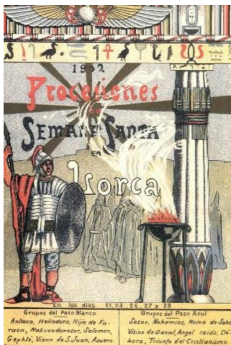
Fig. 2. Tornero Escriñá, Cartel diseñado por el pintor para promocionar la Semana Santa de Lorca, 1902.