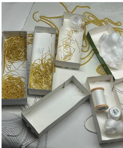
Fig. 38. Materiales empleados en el bordado de oro en realce, 2024.