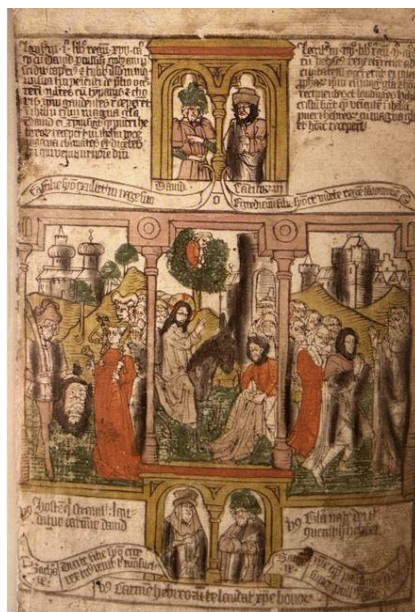
Fig. 31. Ilustración de la Biblia Pauperum , Entrada triunfal de Cristo en Jerusalén. A su izquierda, la prefiguración de David recibido por las doncellas de Jerusalén.

La escena se propone como una prefiguración de la entrada de Jesús en Jerusalén, narrada ya en el Nuevo Testamento. De este modo, siguiendo a López Ayala: