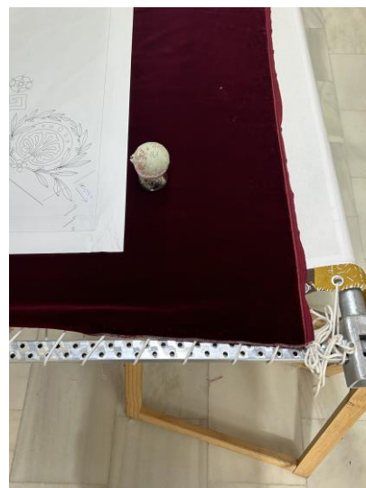
Fig. 44. Bastidor con tela base, tela definitiva y boceto, 2024.

Una vez hechos estos pasos previos, el tejido base se une a las dos varetas del mismo bastidor mediante unas cuerdas tensadas por una especie de tirantes con agujeros. Al mismo tiempo, el bastidor está sujeto con púas (figs. 45 – 46). Estos tirantes son los mismos que en ocasiones se emplean para colgar las cortinas. Así mismo, encima del tejido base, se coloca el tejido definitivo, que suele ser tejido de seda, raso o terciopelo, y se pilla a la tela inferior mediante una serie de puntadas de sujeción con la técnica del perfilado 59 . De este modo, se sujetan los laterales del boceto al tejido donde finalmente se bordará. La plantilla, también se asegura al bastidor en las partes con dibujo mediante unas puntadas largas antes de ser bordado (fig. 47).