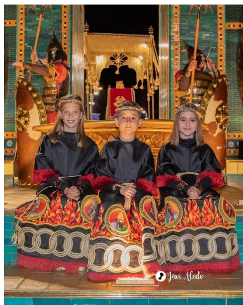
Fig. 10. Versión actual de “Los Tres Niños arrojados al fuego”, 2024.