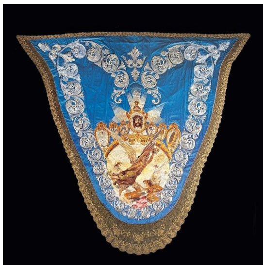
Fig. 22. Manto azul de la Virgen de los Dolores, 1904.