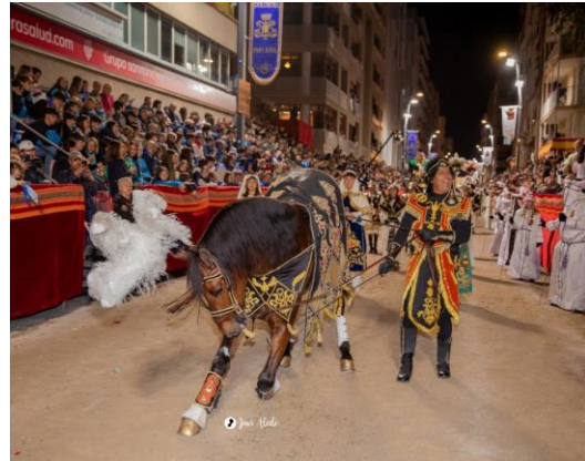
Fig. 13. Fotografía actual del “Caballo del Respeto”, 2024.

En la actualidad, el grupo de Salomón representa desde la corte a pie del rey Salomón hasta la caballería del rey Salomón pasando por el aún presente caballo del respeto, la corte a pie del rey Salomón, la biga del rey Salomón y los plumeros de este.