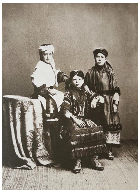
Fig. 9. Primera versión de “Los Tres Niños arrojados al fuego”, 1882.

En la parte trasera, aparece un grupo con tres de los personajes más característicos de esta carroza: “Los Tres Niños arrojados al fuego”. Estos simbolizan a tres niños hebreos lanzados al fuego por negarse a adorar a una estatua de oro fabricada por Nabucodonosor (figs. 9 -10) 16 .