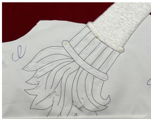
Fig. 47. Detalle puntadas largas en el boceto para evitar su movimiento al bordar, 2024.

En este punto del proceso, dependiendo del tramo que toque bordar se empleará una técnica u otra, pues el bastidor se va abriendo a medida que avanza el trabajo. La bordadora va clavando de arriba hacia abajo la aguja, a la que empuja con el dedal, y la izquierda para hacer la operación inversa 60 . Es importante mencionar que del fragmento que se está bordando, la parte en oro es la que se hace en última instancia, pues es la que más se estropea.