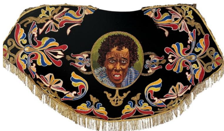
Fig. 29. Capeta del esclavo de la reina Balkis, 1940.

Es uno de los bordados más característicos de la Semana Santa lorquina, más conocido como La Capeta del Negro (fig. 29). El medallón central, se encuentra bordado en terciopelo negro y se muestra ornamentado con motivos vegetales en sedas de colores. Entre otros aciertos de este bordado, destaca la policromía concreta y bien escogida que traslada los detalles de la fotografía original en blanco y negro 38 .