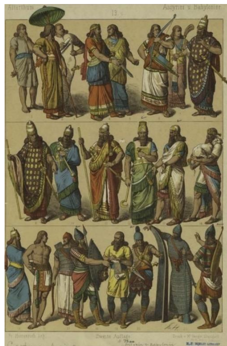
Fig. 7. Inspiración trajes de babilonios y asirios.