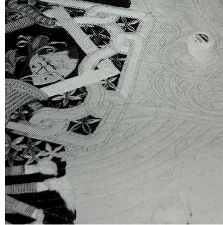
Fig. 21. Proceso de bordado de los mantos de la caballería de Las Sibilas.

La ornamentación y los motivos decorativos bordados a mano vestían la carrera de una gran belleza que se unía al espectáculo de caballo, carros y carrozas, cada vez más elaborado. Como puede verse, el elemento clave que dio el gran sello de identidad a la Semana Santa lorquina, fue el bordado en seda. Además, en esta época surgen algunos de los grandes bordados que analizaremos a continuación.