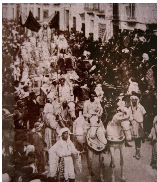
Fig. 16. Primeras imágenes de “Los Cuatro Jinetes del Apocalipsis”.

El tema de la visión del Apocalipsis es representado actualmente por el grupo procesional de La Visión de San Juan, el cual va acompañado de su correspondiente caballería y del grupo “Los Cuatro Jinetes del Apocalipsis” (figs. 16 - 17).