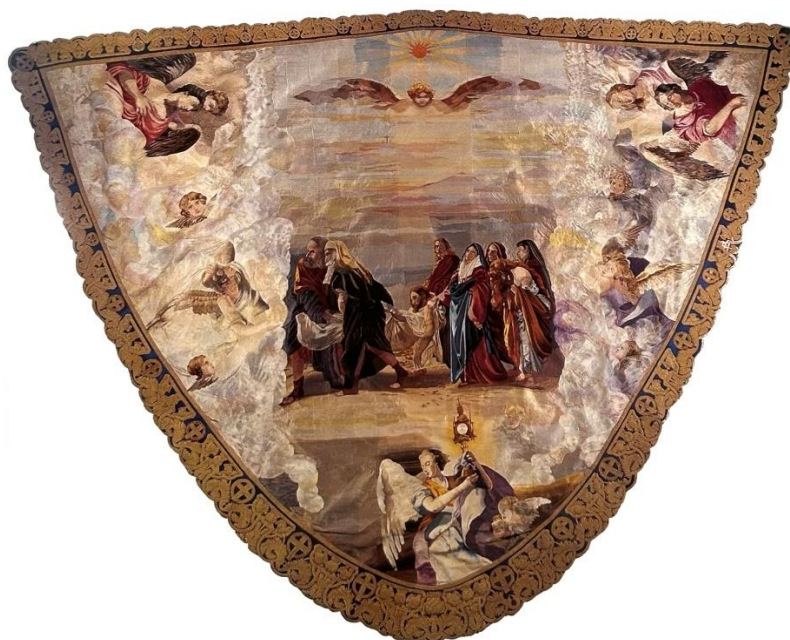
Fig. 24. Manto de la Virgen de la Amargura, 1928.