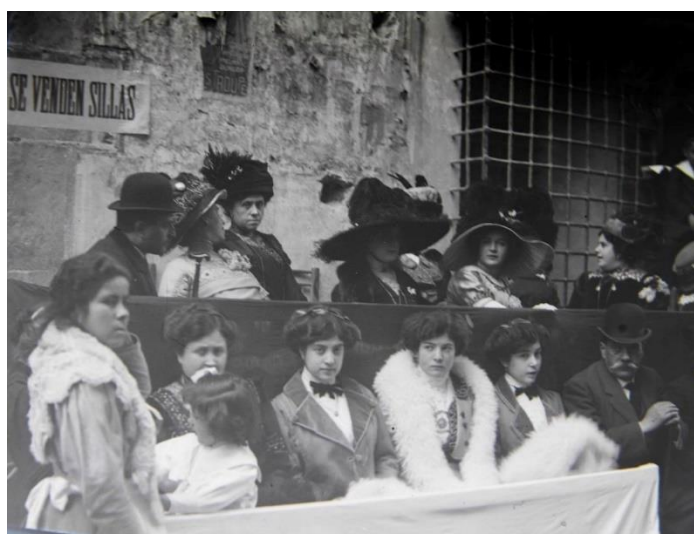
Fig. 1. Primeros palcos de la Semana Santa de Lorca, 1911.

A pesar de ello, este modelo cada vez fue cogiendo más forma y, también popularidad en el resto de España. Esto hizo que numerosos visitantes calmaran su inquietud por conocer la Semana Santa lorquina acudiendo a la ciudad en esta fecha. Tal fue el auge de los desfiles a inicios del siglo XX que se comenzaron a poner una especie de asientos en serie por todo el recorrido de la procesión para que aquellos que pudieran permitírselo, pudieran disfrutar del espectáculo. Actualmente, estos asientos, popularmente conocidos como palcos, son una esencia de la ciudad en Semana Santa (fig. 1).