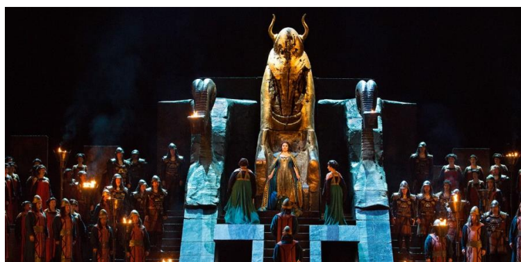
Fig. 34. Imagen actual de la representación de la ópera Nabucco .

Por último, acabando de comentar las fuentes de inspiración de la Semana Santa lorquina y siguiendo a Ros, la influencia que ejerció el ilustrador francés Gustavo Doré en las iconografías, formas y modelos reproducidos por las cofradías blanca y azul de la Semana Santa de Lorca forma parte de otra de las motivaciones esenciales a niveles creativos para entender los desfiles bíblicos pasionales. Doré ha sido reconocido a lo largo de los tiempos por sus ilustraciones en obras como la Biblia, La Divina Comedia de Dante Alighieri (fig. 35) y El Paraíso Perdido de John Milton. Estas, entre otras, han dejado huella en la representación visual de escenas religiosas y mitológicas. Además, sus ilustraciones publicadas en 1882 por Montaner y Simón, incluyen una amplia gama de elementos culturales y estilísticos de diversas épocas y civilizaciones, desde egipcios y romanos hasta griegos, babilonios y asirios. Así mismo, esto proporcionó una valiosa fuente documental para las cofradías blanca y azul y sus primeros directores artísticos en una búsqueda de fidelidad histórica en la escenificación, vestimenta y accesorios de los grupos de los desfiles bíblicos pasionales. Este aspecto enriqueció la puesta en escena de las procesiones lorquinas. Cabe destacar que este libro se encontraba anteriormente ubicado en el casino de Lorca, lo que facilitó aún más su preservación y acceso al público interesado en su contenido histórico y cultural, en este caso, los directores artísticos 50 .