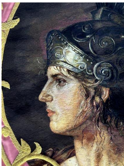
Fig. 49. Detalle de expresión en el manto del Dios Marte, Grupo de La Visión de San Juan, 2024.

A pesar de que actualmente el protagonismo del bordado lorquino esté en el desarrollo que ha experimentado el bordado en seda, este no podría ser entendido sin el bordado en oro, el cual siempre realza las composiciones, dándoles la apariencia tan característica de los bordados de la Ciudad del Sol.