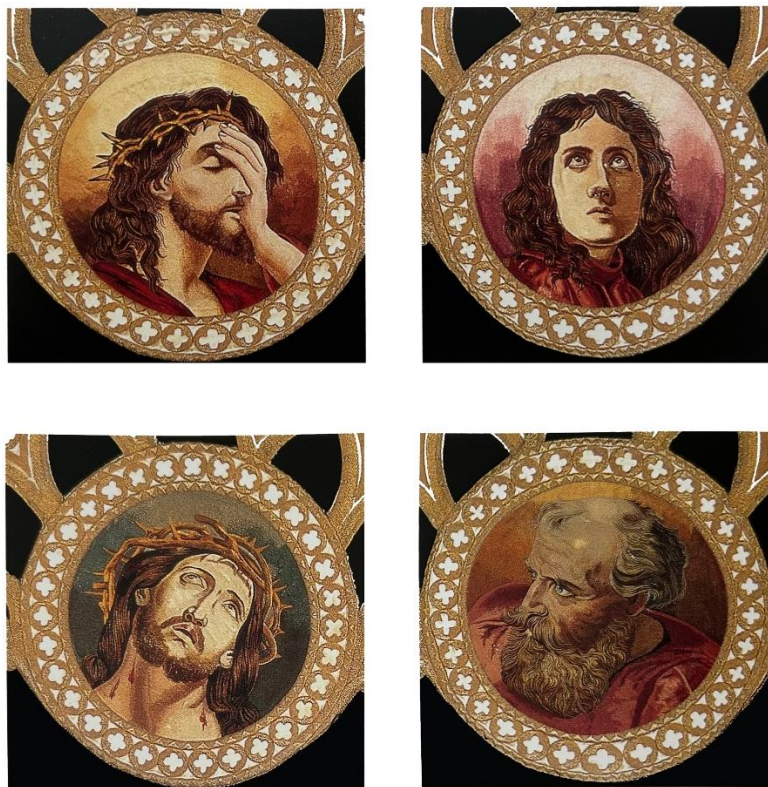
Fig. 26. Paso Blanco, Detalle del Palio del trono de la Virgen de la Amargura, 1943.

En relación a los bordados que aparecen en los paños en sí, se puede encontrar su origen en las siguientes obras: Santa Isabel y el milagro de las rosas (Louise Max Ehrler, s. XIX), Las santas mujeres en el sepulcro (William Bouguereau, 1890), Jesús camino del Calvario (Pierre Mignard, 1684), Resurrección de la hija de Jairo (Heinrich Rauchinger, s. XIX), y Gólgota (Mihály Munkácsy, 1883) (fig. 26). Mediante la adaptación de estas obras al bordado, se consigue evidenciar cómo el bordado lorquino muestra una atención meticulosa a los detalles y una habilidad artística excepcional 35 . Finalmente, el palio de la Virgen de la Amargura, realizado bajo la dirección de José Cánovas, fue terminado en 1928 con el estreno del manto de la Virgen. El dominio de la técnica de bordado puede apreciarse en la amplia gama de colores que otorgan las sedas, además, cabe señalar que el nivel de detalle que se alcanzó con bordados como este incentivó aún más la devoción por las imágenes marianas.