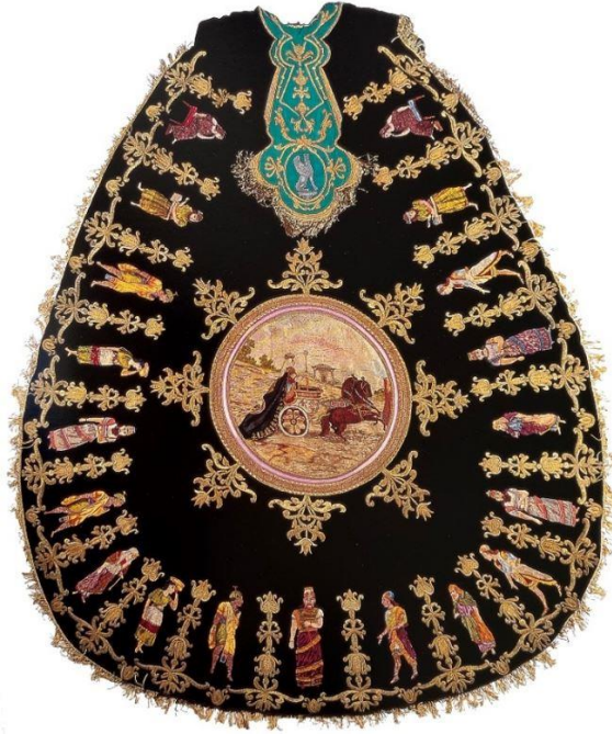
Fig. 28. Manto de Salomón, 1932.

A finales del siglo XIX, durante las procesiones del Paso Blanco, se incorporó una representación del rey Salomón, sucesor del renombrado David, como un tributo al momento histórico de la inauguración del Templo de Jerusalén, que se le atribuye. En 1932, el manto de esta representación fue revitalizado bajo la dirección artística de Emilio Felices Barnés (fig. 28). Este fue diseñado para ser lucido desde un carro.