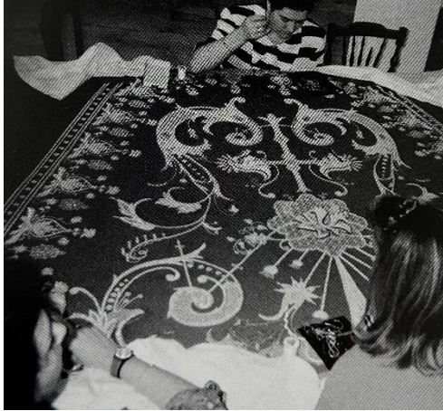
Fig. 20. Bordadoras del Paso Blanco realizando una copia del antiguo manto de la Virgen de la Amargura.