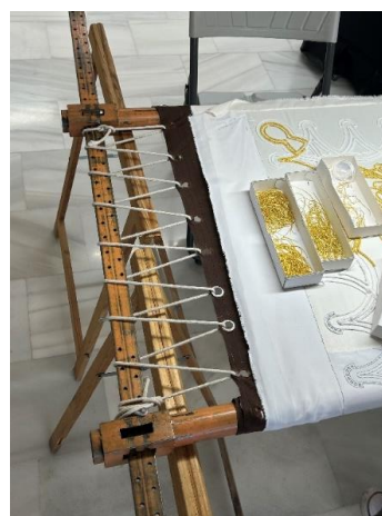
Fig. 46. Bastidor empleado para el bordado lorquino, 2024.