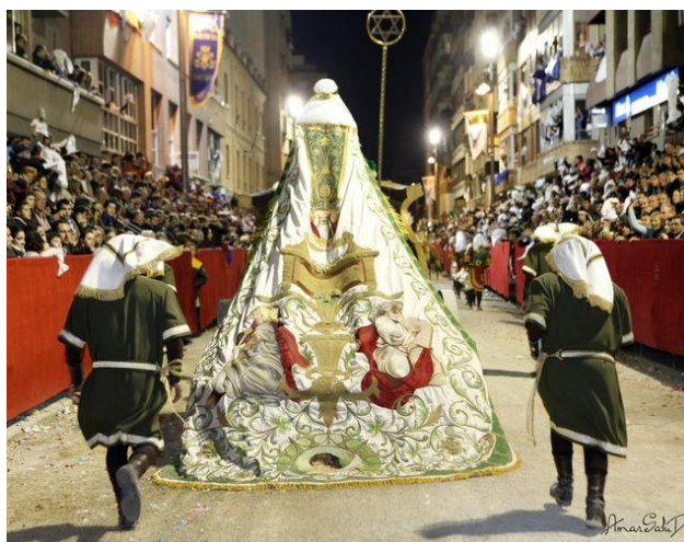
Fig. 3. Manto actual del Rey David en procesión.

En la actualidad, este grupo se presenta por David en una biga (carro tirado por dos caballos) seguida de sus esposas a caballo: Abigail, Micol y Ajinoam, Abital y Eglá, Maaká y Yaaguitt.