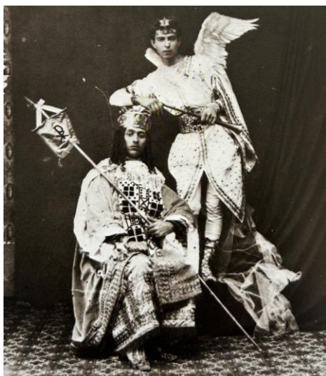
Fig. 14. Ángeles de La Visión de San Juan, 1882.