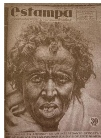
Fig. 30. Portada de la revista Estampa de 1935 con el rostro que se plasma en la Capeta del negro.

Bajo la dirección del mismo Emilio Felices, este bordado corresponde al auténtico rostro de un esclavo de la guerra italo-abisinia 39 . La imagen fue recuperada de la portada de la revista Estampa de 1935 (fig. 30). Ya que este bordado se llevó a cabo en plena Guerra Civil, su estreno se produjo en los años 40.