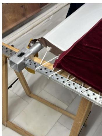
Fig. 45. Detalle del bastidor sujeto con tirantes y púas, 2024.

Una vez hechos estos pasos previos, el tejido base se une a las dos varetas del mismo bastidor mediante unas cuerdas tensadas por una especie de tirantes con agujeros. Al mismo tiempo, el bastidor está sujeto con púas (figs. 45 – 46). Estos tirantes son los mismos que en ocasiones se emplean para colgar las cortinas. Así mismo, encima del tejido base, se coloca el tejido definitivo, que suele ser tejido de seda, raso o terciopelo, y se pilla a la tela inferior mediante una serie de puntadas de sujeción con la técnica del perfilado 59 . De este modo, se sujetan los laterales del boceto al tejido donde finalmente se bordará. La plantilla, también se asegura al bastidor en las partes con dibujo mediante unas puntadas largas antes de ser bordado (fig. 47).