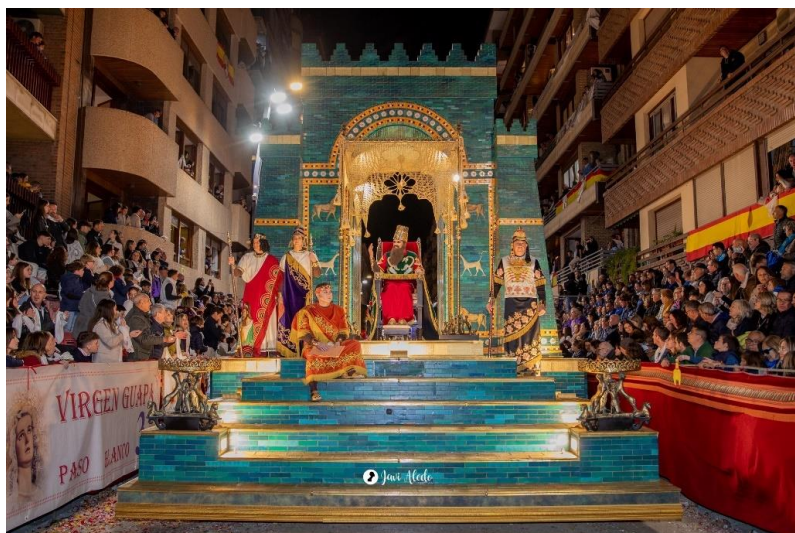
Fig. 8. Carroza del Rey Nabucodonosor del Paso Blanco, 2024.

En la parte trasera, aparece un grupo con tres de los personajes más característicos de esta carroza: “Los Tres Niños arrojados al fuego”. Estos simbolizan a tres niños hebreos lanzados al fuego por negarse a adorar a una estatua de oro fabricada por Nabucodonosor (figs. 9 -10) 16 .