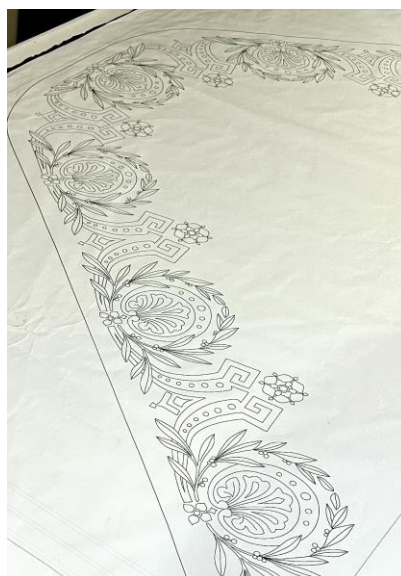
Fig. 37. Boceto elaborado por la comisión artística mediante transfer digital, 2024.

consiste en la impresión de una plantilla previamente diseñada de forma digital que se envía a la empresa que realizará la transferencia del dibujo a línea. La impresión se realiza en una especie de tejido de textura plástica con el fin de evitar el movimiento del boceto a la hora de bordar. El uso de esta técnica de tecnología avanzada permite un refinamiento exquisito en los bordados, pues como aseguran las costureras, de este modo se consiguen “infinitos detalles”, además de una facilitación del trabajo 53 . Cabe destacar, que la cofradía del Paso Blanco fue pionera en la utilización de esta técnica novedosa que hoy usan prácticamente el resto de las cofradías. Aunque al principio la comisión artística del Paso Azul cuestionaba su uso, alegando la pérdida del hacer original del bordado lorquino, pocos años después comenzó a trabajar con la misma herramienta debido a sus excelentes resultados.