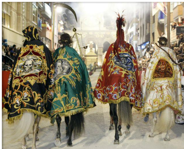
Fig. 18. Detalle de los mantos de “Los Cuatro Jinetes del Apocalipsis”.

Según el estudio realizado por Gaspar José López de Ayala, la Revista programa de las procesiones que han de celebrarse en Lorca en el presente año 1885 , da constancia de que la figura de “Los Cuatro Jinetes del Apocalipsis” ya inundaba la carrera por entonces 23 . Estos escenifican varios pasajes del Apocalipsis, libro profético de carácter escatológico. Los jinetes encabezarán a las fuerzas del bien en la victoriosa lucha final contra el mal en la visión de San Juan Evangelista que tuvo en la isla de Patmos. Los Cuatro Jinetes, cuyos mantos actuales fueron estrenados en 1972, representan la muerte (manto negro), el hambre (manto verde con una balanza, signo de medida en tiempos de carencias) la guerra (manto rojo y espada) y la peste (manto blanco) (fig. 18).