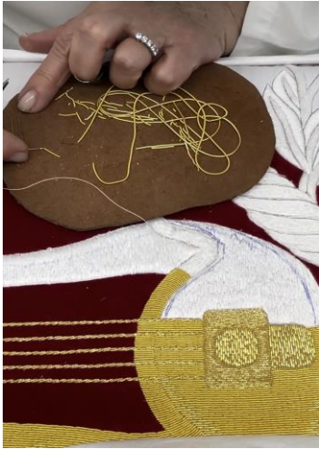
Fig. 40. Paso 1 bordado en oro; cogiendo canutillo con aguja, 2024.