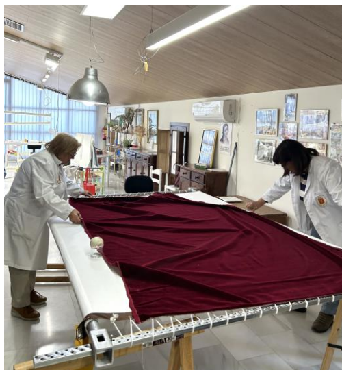
Fig. 43. Estudio espacial de la colocación del boceto en el tejido definitivo, 2024.