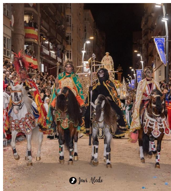
Fig. 17. Imagen actual de “Los Cuatro Jinetes del Apocalipsis”, 2024.

Antiguamente, este grupo estaba formado por el Trono Santo de Dios Vivo, delante del cual se mostraban “Los Veinticuatro Ancianos”, figuras medievales que reclaman la llegada del reino mesiánico y el Día del Juicio 21 . Así mismo, a partir de 1891,