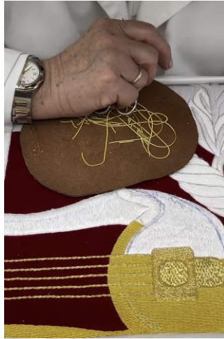
Fig. 41. Paso 2 bordado en oro; después de haber clavado la aguja con el canutillo para insertarlo, 2024.