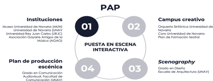
Gráfico 1: Organigrama del proyecto

Financiación: Museo Universidad de Navarra (UNAV). Proyecto del Campus Creativo