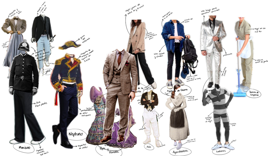
Imagen 2: Ejemplos. Bocetos de vestuario propuestos