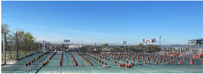
Fig. 1. Vista del experimento donde se pueden apreciar las 272 macetas y su disposición.

Paralelamente en CULTIVE se estableció este experimento con 272 macetas. Una de las plantas solitarias murió en el inicio del experimento quedando finalmente 271 macetas.