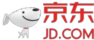
Figura 21: imagotipo de JD