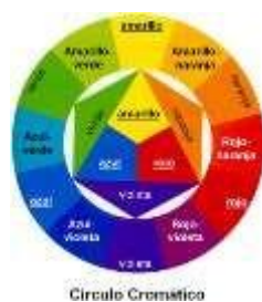
Figura 2: Colores complementarios

A esto se le denomina círculo cromático. En la imagen se muestra también la pirámide de los colores primarios y los colores secundarios, lo que nos proporciona más facilidad para imaginarnos cómo se forman los colores.