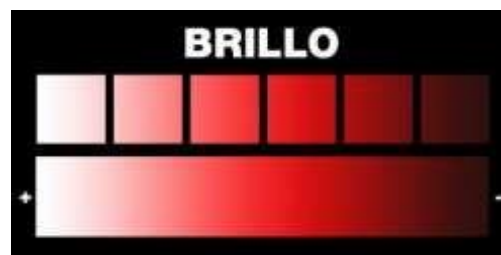
Figura 5: Escala de rojos de más a menos brillantes

Cuanto más mezclado un color con el blanco más luminosidad tiene.