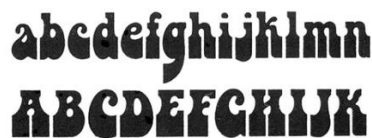
Figura 18: Ejemplo de la categoría decorativa

Decorativas: engloba aquellas fuentes que son difíciles de catalogar y cuyo diseño tiene como objetivo principal impactar visualmente. Estas tipografías son adecuadas para su uso en titulares o encabezamientos, pero no se recomienda su aplicación en bloques extensos de texto, ya que su aspecto formal puede dificultar la lectura. En este caso, la legibilidad del tipo pasa a un segundo plano, y su función principal es evocar una temática específica o simplemente destacar en la composición. Gracias a la tecnología actual, no es necesario ser un experto en tipografía para crear fuentes de este estilo, lo que ha permitido que estas tipografías proliferen ampliamente.