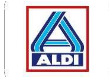
Figura 20: imagotipo de Aldi