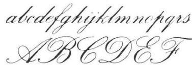
Figura 18: Ejemplo de la categoría script

Script (o caligráfica): este tipo de categoría se caracteriza por su inspiración en la escritura manual, lo que se refleja en un eje principal inclinado. Sin embargo, debido a su complejidad en la elaboración, no son adecuadas para su uso en bloques extensos de texto, ya que dificultan la legibilidad. Algunos ejemplos de este estilo incluyen la Brush Script, con un diseño informal, y la Kuenstler Script , que presenta un aspecto más formal. En la figura 17, se puede observar que el número de caracteres en minúsculas que pueden encajar en el mismo espacio es mayor que en otras categorías, debido a que los caracteres están conectados entre sí. Por otro lado, las letras mayúsculas presentan remates elaborados y decorativos.