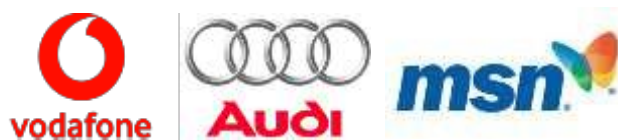
Figura 11: Ejemplos de imagotipos

Imagotipos: “también llamados ‘logosímbolos’, cuando lo que hay es un logotipo y un isotipo acoplados, pero claramente diferenciados —por ejemplo, uno se encuentra arriba y el otro abajo o uno a la derecha y el otro a la izquierda—, de manera que pueden funcionar y ser utilizados por separado” (Olivares, 2014). En resumen, podemos decir que es igual a la suma de un logotipo y un isotipo.