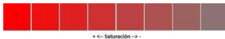
Figura 4: Escala de rojos de más a menos saturados