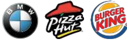
Figura 12: Ejemplos de isologos