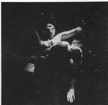
Escena de El son entero.