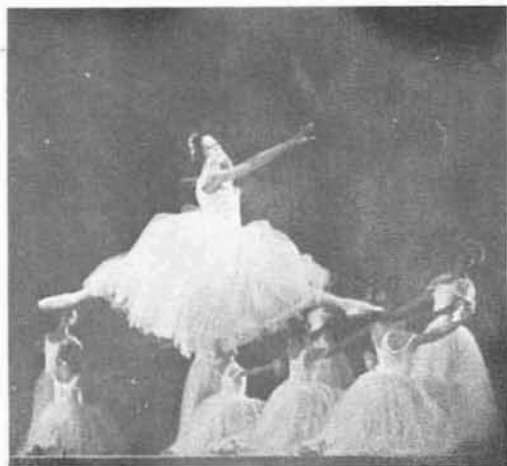
La solista Clotilde Peón.