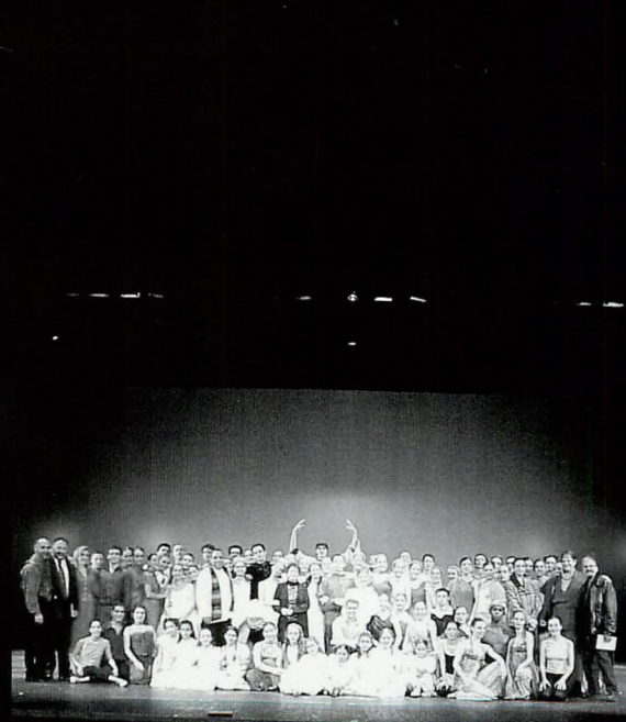
Grupo de graduados y profesores