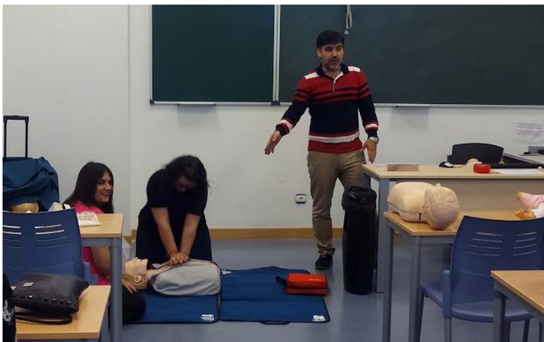
Ilustración 2. Jornadas de primeros Auxilios