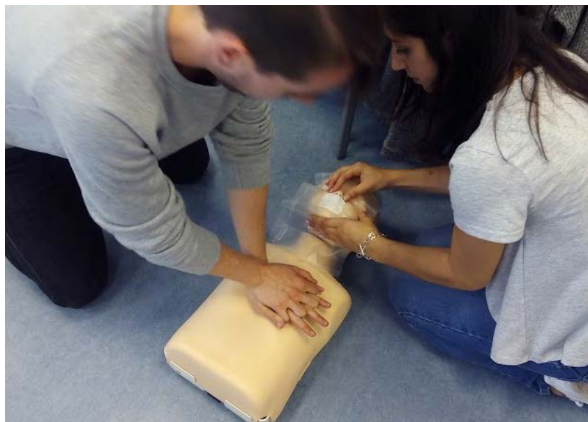
Ilustración 7. Jornadas de primeros Auxilios