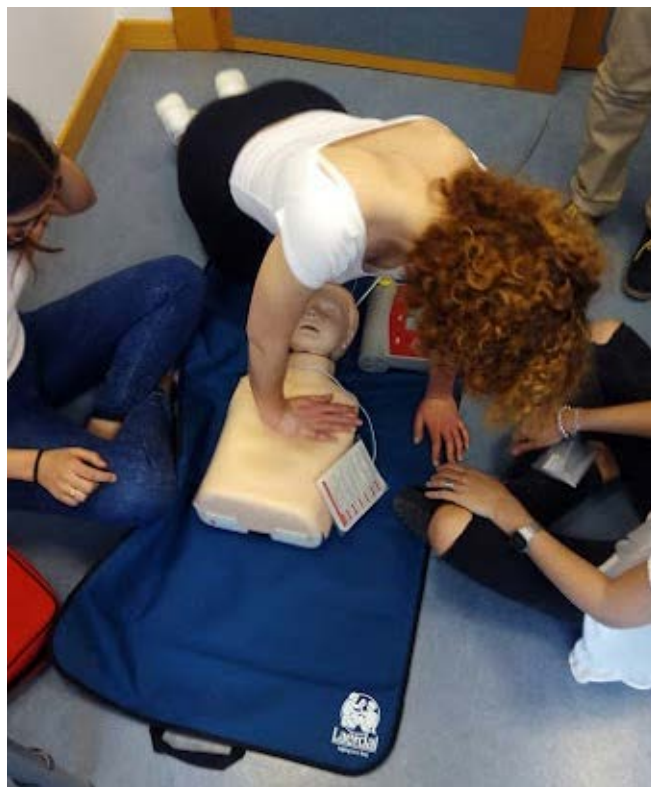
Ilustración 6. Jornadas de primeros Auxilios