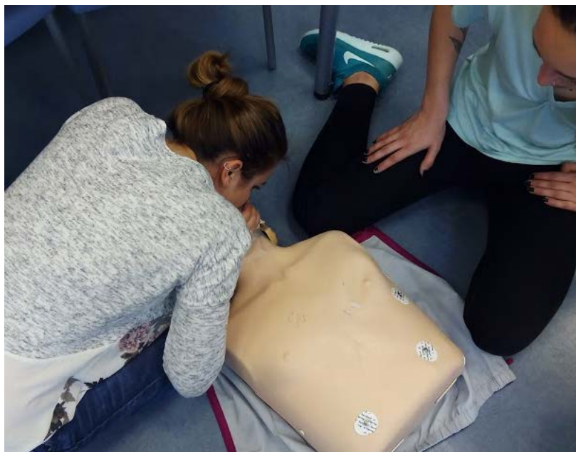
Ilustración 4. Jornadas de primeros Auxilios