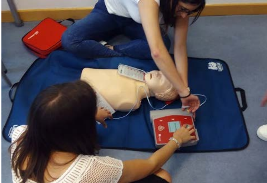
Ilustración 5. Jornadas de primeros Auxilios