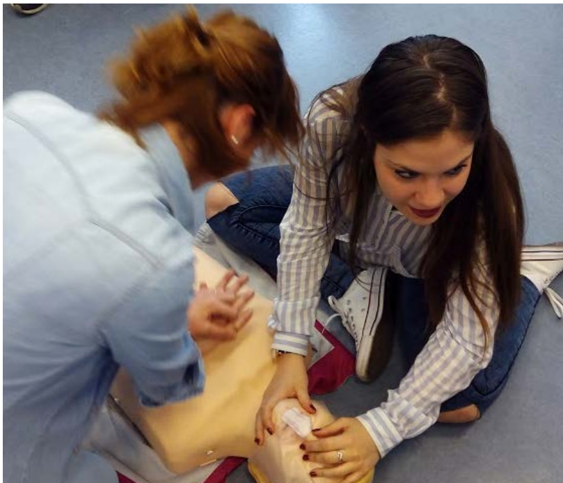
Ilustración 3. Jornadas de primeros Auxilios