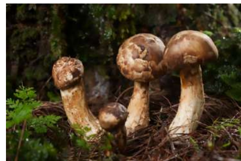
FIGURA 06» Hongo Matzuke.