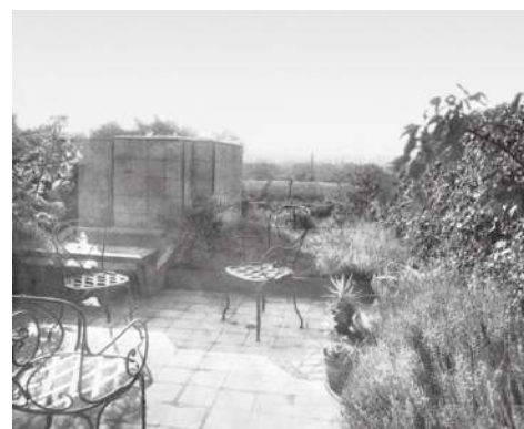
FIGURA 02 » Le Corbusier, la cubierta-jardín de su apartamento en la azotea del inmueble en la Puerta Molitor en París, tras su 'renaturalización'. Fuente: Sentkiewicz 2019, p. 48 tras su 'renaturalización'. Fuente: Sentkiewicz 2019, p. 48

Por un lado, el jardín 'salvaje' de la azotea del apartamento de Le Corbusier parece seguir inscrito en una lógica antropocéntrica que contraponen lo salvaje a lo domesticado, puesto que los elementos naturales involucrados siguen proponiéndose como elementos cuasi decorativos, objetivados como materiales de construcción adicionales o auxiliares a los convencionales. Adicionalmente, cabe señalar que a los acontecimientos que han provocado esta suerte de 'renaturalización' del jardín les falta totalmente uno de los elementos clave de cualquier proyecto: la 'intencionalidad'. Sin embargo, por otra parte, es interesante observar cómo este 'accidente' desencadenó una decisión 'técnica' que transformó algo fortuito en algo 'intencional': el asombro de Le Corbusier frente a la renaturalización de su techo-jardín de la rue Nungesser et Coli en París fue tal que, a partir de este episodio, una capa de 20-30 cm de tierra se convertiría en un material de construcción que emplearía en otros proyectos, en los que las cubiertas de hormigón dejarían de ser 'desnudas' 5 .