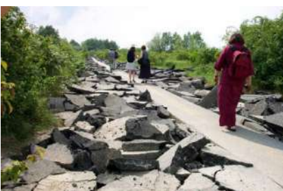
FIGURA 08 » GTL, proyecto del desmantelamiento parcial del antiguo aeródromo militar de Bonames, en Fráncfort del Meno, 2004. Pista de aterrizaje posterior a la intervención.