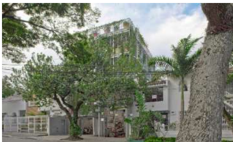
FIGURA 05 » Husos Architects, Edificio Jardín Hospedero y Nectarífero para Mariposas de Cali (EJHNCM) (2012).

A través de esta lente, se pueden detectar y leer algunas experiencias contemporáneas que apuntan hacia nuevas materializaciones y nuevos protocolos en la relación entre arquitectura y naturaleza. En la House with plants (2009-2012) (fig. 4) de Junya Ishigami, por ejemplo, el jardín forma parte del edificio, no se concibe como algo accesorio a la arquitectura, sino como algo que se construye 'con' la arquitectura, generando un paisaje a medio camino entre lo urbano, lo doméstico, lo íntimo, dotado de distintos gradientes de esta comunión con la naturaleza (Amoroso y Zambrano Pilatuña 2021, p. 30-31).