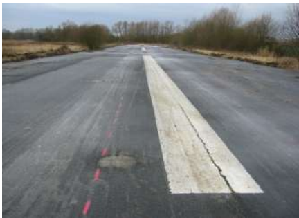
FIGURA 07 » G Aeródromo militar de Bonames, Pista de aterrizaje antes de la intervención.