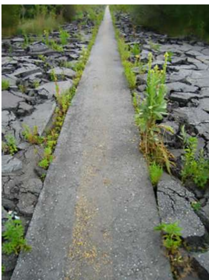
FIGURA 09 » GTL, proyecto del desmantelamiento parcial del antiguo aeródromo militar de Bonames, en Fráncfort del Meno, 2004. Las cavidades generadas por las fracturas del firme han sido paulatinamente colonizadas por plantas y animales.

En estos contextos, este hongo colabora para sobrevivir con las raíces de los árboles entre las que crece, intercambiando nutrientes; muchos intentos para cultivarlo, puesto que se trata de un hongo muy apreciado y codiciado por su sabor y olor, sobre todo en Japón, han fracasado, precisamente porque resulta imposible reproducir la complejidad de las condiciones que permiten que se desarrolle: necesita la dinámica diversidad multiespecie de la foresta para sobrevivir (Tsing 2012, p. 516).