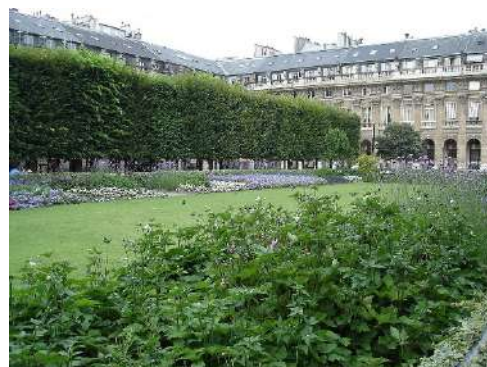
FIGURA 01 » Jardines hacia el interior del Palais Royal Paris. Fuente Russell Yarwood.

El enfoque higienista del siglo XIX incorporó la naturaleza al espacio urbano y a las viviendas sólo en términos decorativos y/o recreativos, a través de parques y jardines (fig. 1). Sin embargo, este proceso de exclusión y separación entre esfera pública y privada — que refleja también la división entre naturaleza y cultura que se consolidó precisamente en estas arquitecturas y formas de 'domesticar' lo natural, marcando los límites entre un afuera y un adentro — no es una novedad del sistema cultural de la Ilustración, puesto que ha existido desde la antigüedad. En la República de Platón se contraponía la esfera pública de la polis a la privada del oikos ; sin embargo, tal y como señala Étienne Helmer (2012), para Platón el oikos es un dispositivo político necesario y beneficioso para alcanzar la unidad y cohesión ciudadana. De acuerdo con María Kaika (2004, p. 265), se puede afirmar que para Platón ambas esferas, tanto la pública como la privada, constituían dos posibles escenarios de la praxis política. Fue a partir de la Ilustración cuando realmente recibió un impulso decisivo la identificación entre la idea de libertad individual y el derecho a un espacio privado (exclusivo y excluyente): la esfera privada aislada, en tanto que lugar sagrado en el que expresar esa libertad individual, empezó a formar parte de un proyecto, a la vez social e intelectual, de emancipación más amplio (Gay, 1973).