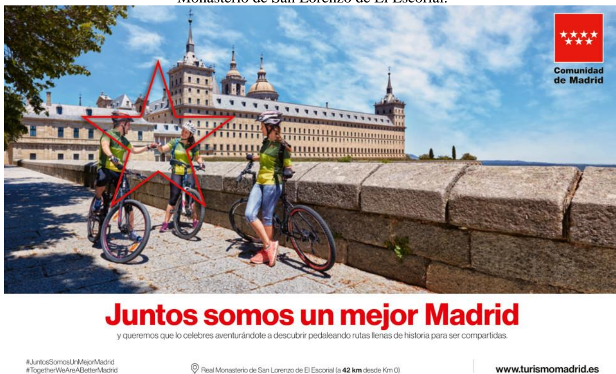
Figura 3. Campaña de promoción turística de la Comunidad de Madrid con el Real Monasterio de San Lorenzo de El Escorial.

A este respecto, la Comunidad de Madrid ha puesto en marcha recientemente numerosas acciones que acercan el destino y sus recursos culturales al turista local. Una de las campañas que mejores resultados ha obtenido ha sido “Juntos somos un mejor Madrid” (Comunidad de Madrid, 2020, 28 de mayo) (Figura 3).