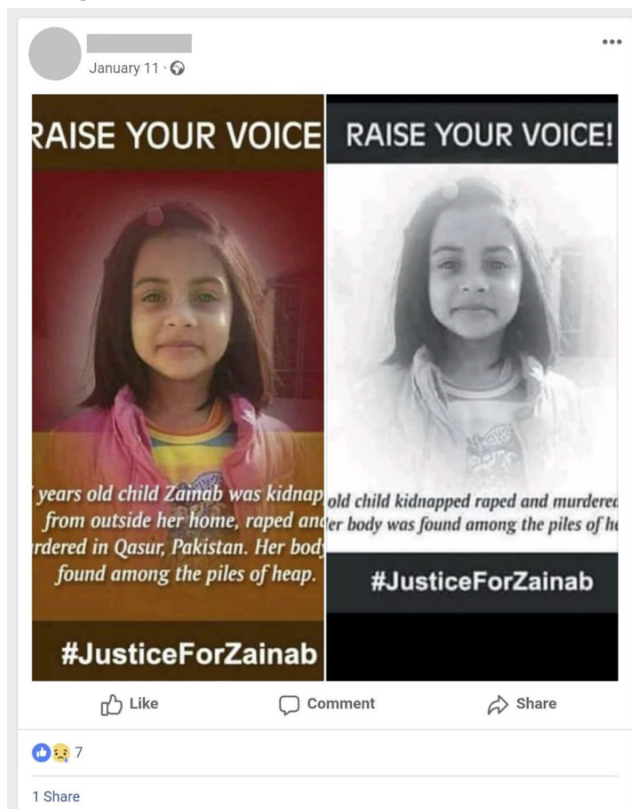
Figura 4. Asesinato de una niña en Pakistán 7