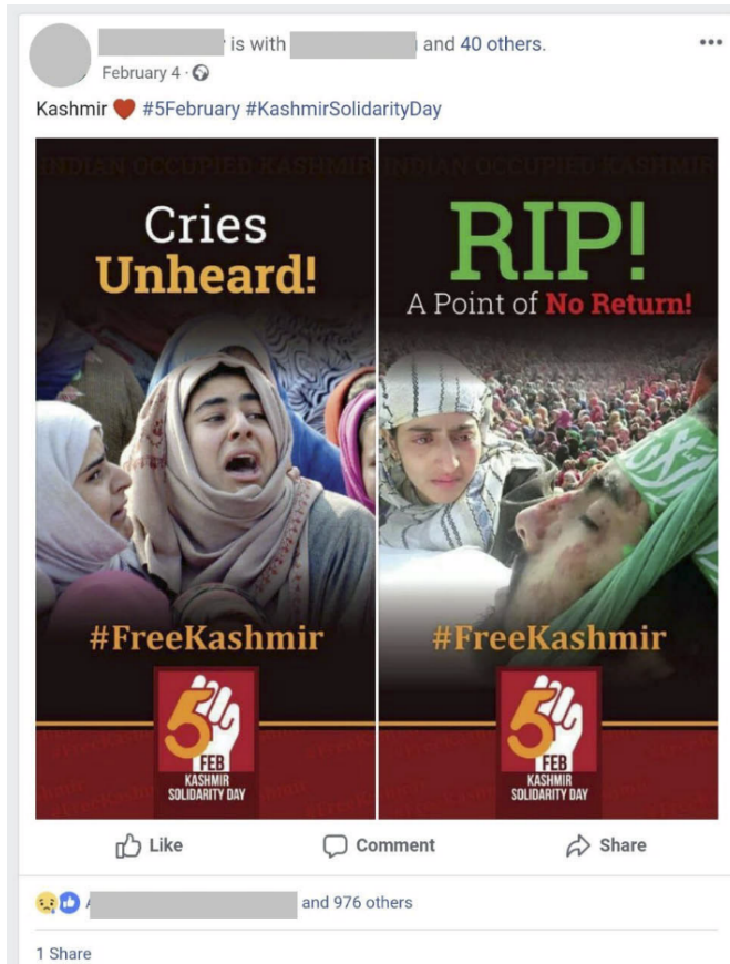
Figura 3. Celebraciones por el día de solidaridad con Cachemira 6