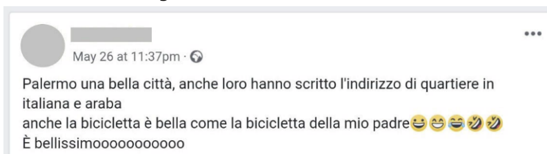
Figura 5. Visita a Palermo de R8 9