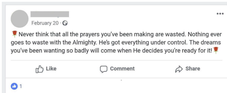
Figura 8. Positividad y resiliencia en el estado de R2 13