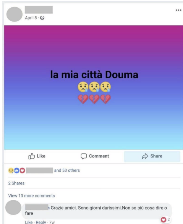
Figura 12. Expresión del sufrimiento por su ciudad en guerra 17