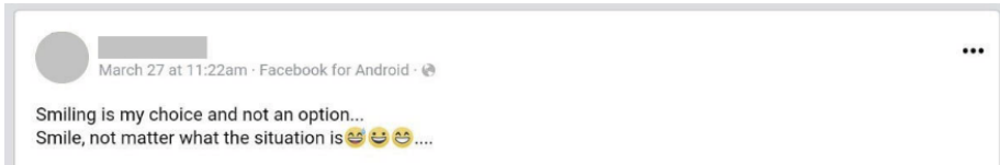
Figura 7. Positividad y resiliencia en el estado de R5 12