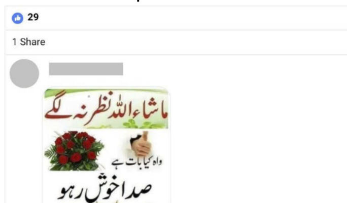
Figura 2. Celebraciones de cumpleaños en Facebook-Comentarios recibidos 4