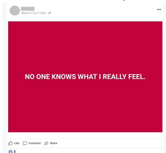
Figura 9. Manifestación de desánimo y soledad de R4 14