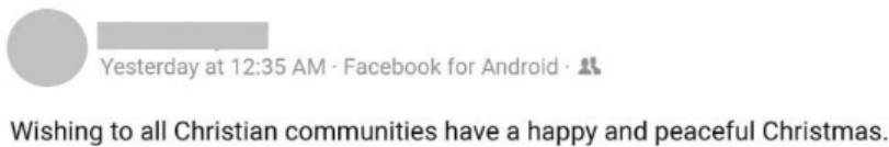
Figura 10. Deseos para la Navidad de R18c 15