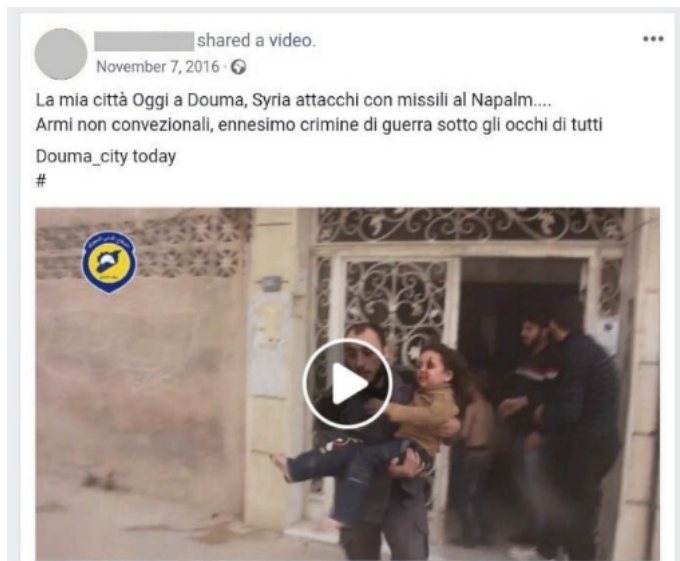
Figura 11. Ataques en Douma 16