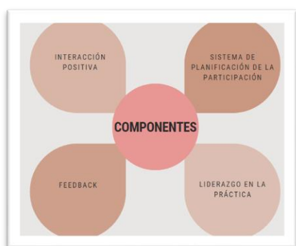
Figura B: Componentes del Apoyo Activo.

Hay que recalcar cinco premisas relativas a la generación de oportunidades para que estas personas puedan adquirir una vida plena con el apoyo activo: crear relaciones sociales importantes para la persona, participar activamente en sus actividades diarias, tomar decisiones con el apoyo preciso, tener un rol valorado por su red social y realizar acciones importantes para ellos/as. (Garrido, L. y González, B. 2019)