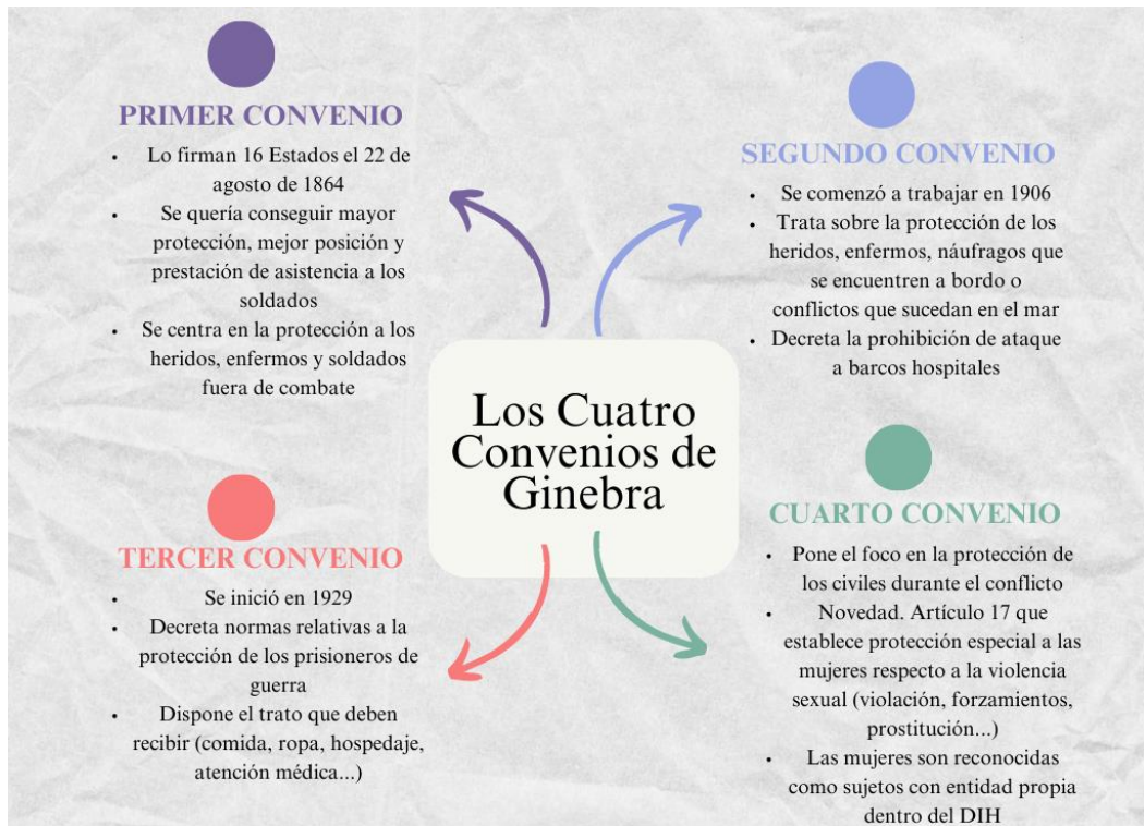
Ilustración 1. Los Cuatro Convenios de Ginebra

Elaboración propia. Fuente (Comité Internacional de la Cruz Roja, 2014) (Marchorí, 2022).