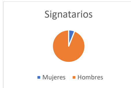
Gráfico 4 Porcentaje de mujeres y hombres como signatarios en procesos de paz entre 1992 y 2019