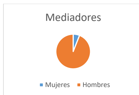
Gráfico 2 Porcentaje de mujeres y hombres como mediadores en procesos de paz entre 1992 y 2019

Elaboración propia. Fuente (Blasco, 2021)