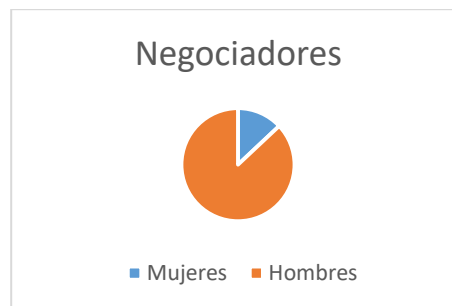
Gráfico 3 Porcentaje de mujeres y hombres como negociadores en procesos de paz entre 1992 y 2019

Elaboración propia. Fuente (Blasco, 2021)