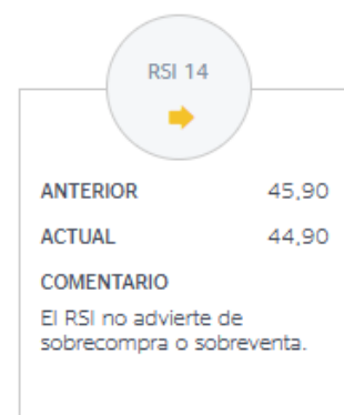
Imagen 4. Indicador de fuerza relativa (RSI) eDreams Odigeo.

También se tiene en cuenta el oscilador RSI, tal y como se puede observar en la imagen 4, con un resultado de 44,90, un punto por encima del mismo nivel anterior. Al estar entre la zona entre 30 y 70 se considera que está en una posición neutral y que, por tanto, este indicador no representa ni sobrecompra ni sobreventa. (BBVA, 2024)