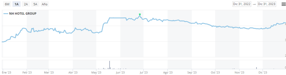
Imagen 7. Gráfico cotización bursátil 1 año NH Hotels.

Se da comienzo el análisis técnico incorporando el análisis bursátil de NH Hotel Group de manera gráfica a lo largo de enero de 2023 a enero de 2024, a través de la imagen 7, empleando para el estudio el precio de capitalización mínimo en 3,51 y el máximo en 4,7.