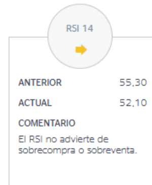
Imagen 8. Indicador de fuerza relativa (RSI) NH Hotels Group.

Para finalizar, se expone el oscilador RSI calculado por los analistas de BBVA, (2024). Como se puede observar en la imagen 8, el grupo empresarial NH Hotels alcanza un RSI de 52,10 inferior al obtenido anteriormente de 55,30. Gracias a estos resultados podemos dictaminar que, al encontrarse entre el baremo de los 50 y 70 puntos, la acción se encuentra en opción de sobrecompra con un incremento en los precios. Sin embargo, también hay que tener en cuenta que el oscilador se encuentra cercano al nivel de 50, momento considerado como óptimo para la entrada o salida del mercado.