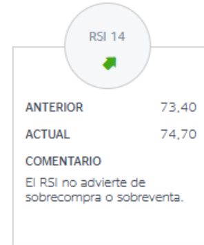
Imagen 6. Indicador de fuerza relativa (RSI) Meliá Hotels.

Por último, a través de la imagen 6 se proporciona el oscilador de fuerza relativa proporcionado por la empresa BBVA, (2024). Su resultado es 74,70 un punto menos que el resultado anterior. No se encuentra entre los valores estándares de 30 y 70, sin embargo, al no estar alejado del último valor no se considera que indique altas variaciones. Por tanto, se dicta que esta acción no se encuentra ni en situación de sobrecompra ni de sobreventa.