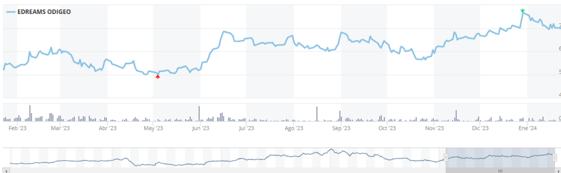
Imagen 3. Gráfico cotización bursátil 1 año Edreams Odigeo.

El análisis técnico se basa en el estudio del BME con el gráfico histórico en el periodo de un año de la empresa Edreams Odigeo. Así se estima, como se presenta en la imagen 3 y apoyado por el análisis realizado por los analistas de la empresa BBVA una resistencia establecida entre 6,87 y 7,16 y unos niveles de soporte que oscilan de 5,63 a 6,01. Tanto a largo como a corto plazo, técnicamente se espera una tendencia bajista si no se supera el valor de 6,87, lo que supone un aumento en el riesgo de sobrecompra.