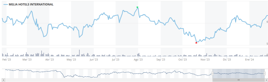
Imagen 5. Gráfico cotización bursátil 1 año Meliá Hotels

En otro aspecto, el análisis técnico inicia con el análisis gráfico de la cotización en bolsa de la compañía gracias a los datos ofrecidos por el BME, (2024). Tal y como se aprecia en la imagen 5 la empresa adquiere una cotización a lo largo del año 2023 que varía según suba o baje su precio en el mercado.