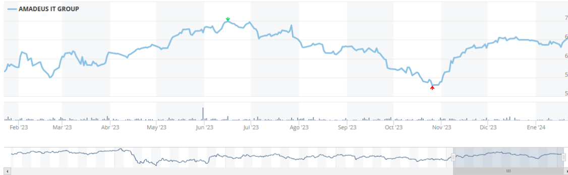
Imagen 1. Gráfico cotización bursátil 1 año Amadeus IT.

En el análisis técnico, se examina el gráfico histórico de cotización durante el último año en el periodo de enero de 2023 a enero de 2024 proporcionado por BME, como se muestra en la imagen 1. A partir del mismo se observa en una primera observación los valores aproximados que obtiene la sociedad estimando los momentos tanto de subida como de caída.