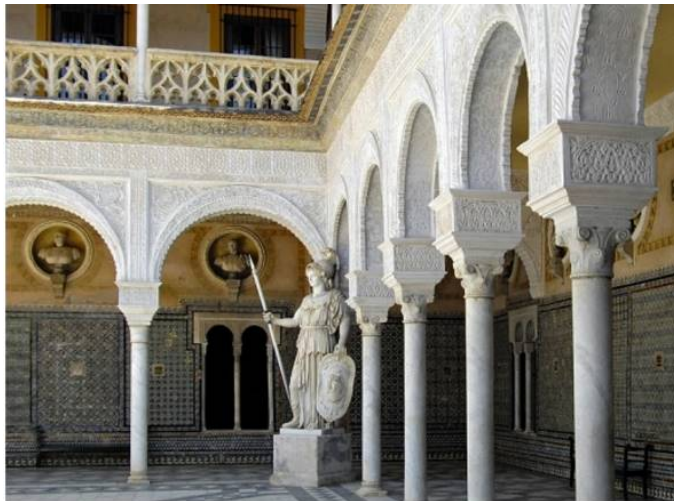
Figura 1. Patio de la “casa de Pilatos”, siglo XVI, Sevilla.

El ambiente cultural de Sevilla propició una cierta afición por el coleccionismo. Así, podríamos citar la colección de Argote de Molina, o la de escultura clásica en el palacio del duque de Alcalá conocido como “la casa de Pilatos”, actualmente perteneciente al ducado de Medinaceli 11 . La entrada en la ciudad de oro y otros productos importados de América contribuyeron a trasladar una gran opulencia a los palacios y residencias señoriales, en los que se llevaron a cabo suntuosas reformas, casi todas realizadas en un estilo renacentista con marcado acento italiano, del que la mencionada casa de Pilatos fue pionera. Recordemos que don Fadrique, marqués de Tarifa y Alcalá, en una de las escalas de su peregrinación a Tierra Santa, encargará a los talleres de los Aprile en Génova la portada clásica a modo de arco de triunfo, así como veinticuatro columnas de mármol y dos fuentes de taza ochavada 12 .