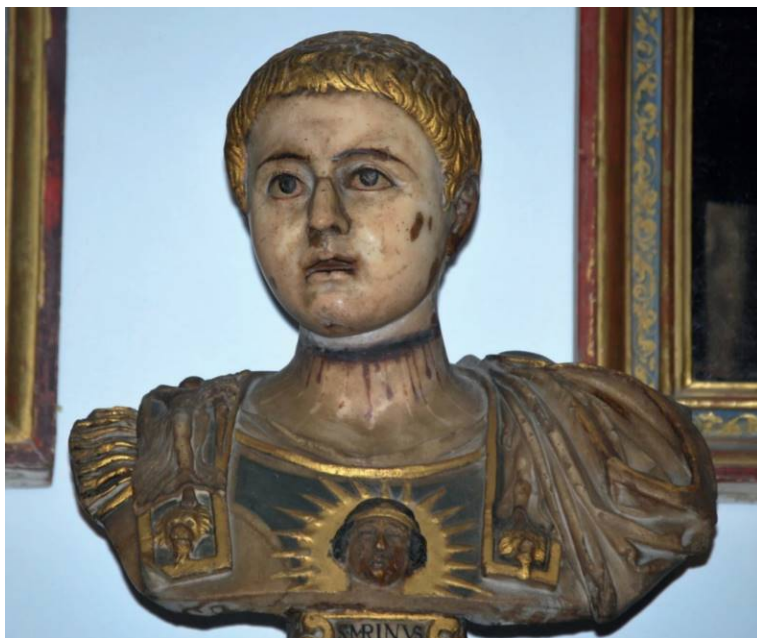
Figura 2. Busto de emperador romano convertido en San Marino, siglo II-III d.c, Colegio del Patriarca, Valencia.

Ya en el siglo siguiente Felipe IV, quizás emulando a lo que había hecho Francisco I en el castillo de Fontainebleau y como estaban haciendo sus contemporáneos Carlos I de Inglaterra o Luis XIII de Francia, envió a Diego Velázquez 20 a Italia “con embajada extraordinaria para comprar pinturas originales y estatuas antiguas y vaciar algunas de las más celebradas” 21 . Como es sabido, Velázquez tuvo problemas para comprar originales de escultura clásica y solo llegaron a Madrid vaciados de aquellas obras, entre ellas el famosísimo Hércules Farnese y Flora 22 o el Laocoonte , el Apolo , Antínoo , el Nilo , Cleopatra , la Venus de Medici , los Luchadores y un grupo de las Niobides , todos de la colección del