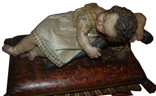
Figura 5. Niño Jesús dormido sobre una cruz , plomo, anónimo, Colección particular.