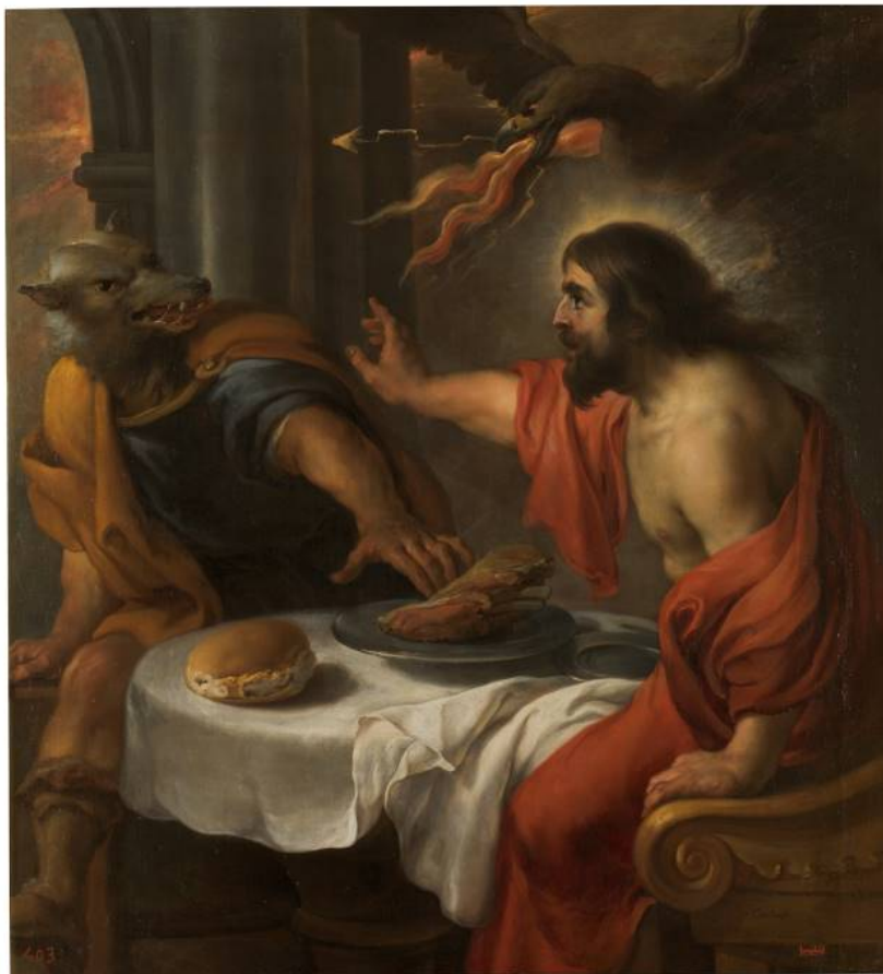
Figura 11: Júpiter y Licaón de Jan Cossiers, 1636-1638.