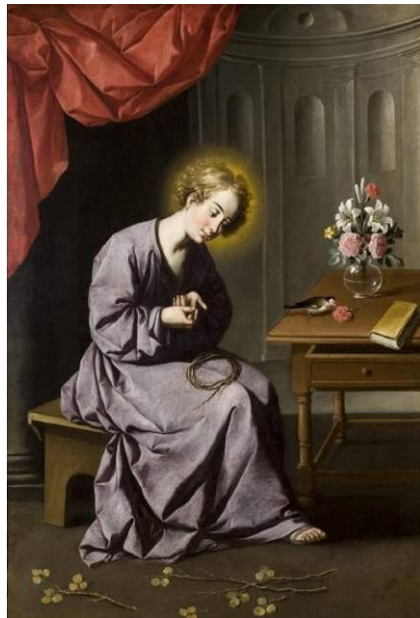
Figuras 6 y 7. El espinario , Cesare Sebastián, hacia 1650, copia de un original romano © Museo Nacional del Prado. El niño de la espina , Francisco de Zurbarán 1630/1650. Fuente: © Museo de Bellas Artes de Sevilla.

Sin duda el que mejor recreará esta iconografía en pintura durante el barroco será Francisco de Zurbarán, como en su “casa de Nazaret, de la que se conocen tres versiones, o en las que aparece de manera individualizada (fig. 7). En ellas se muestra a Jesús mirando fijamente el dedo sangrante que se acaba de pinchar con la corona de espinas que tiene en su regazo. Este tema es un episodio premonitorio de la Pasión, pintado por el artista de Fuente de Cantos en varias ocasiones y que narra Ludolfo de Sajonia, el Cartujano, en su libro Vita Christi , escrito en latín hacia 1350 y traducido al castellano en Sevilla en 1537 56 . La sangre que aparece en el dedo del Niño que se acaba de pinchar vendría a ser una premonición de la pasión del propio Cristo.