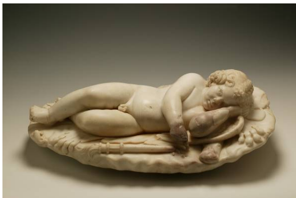
Figura 4. Eros dormido sobre las armas de Hércules , Museo Arqueológico Nacional.

Señora del Valle en Manzanilla (Huelva). Se trata de una talla en la que el Niño aparece sobre una cruz mientras recuesta su cabeza sobre una calavera. También son destacables el Niño Jesús dormido sobre la calavera que se encuentra en el convento de madres justinianas de Cuenca o el del convento sevillano de San José del Carmen, popularmente llamado de las Teresas. Aquí aportamos también uno en plomo de una colección particular de Sevilla (fig. 5) como ejemplo de una serie de niños Jesús muy difundidos por la Península y fechables a finales del siglo XVI 49 .