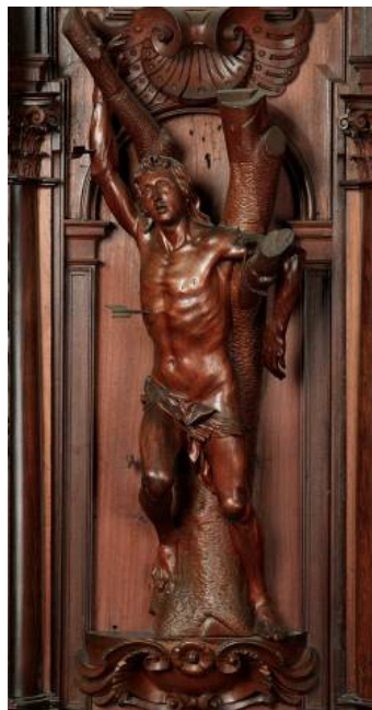
Figuras 12 y 13. Apolo Sauróctono , Praxíteles. San Sebastián , Pedro de Mena, sillería de la catedral de Málaga.

Como observó Francis Haskell hablando del Laocoonte, el rostro dolorido de este “fue un modelo para una amplia producción de imágenes sufrientes o santos martirizados”. En esta imagen vemos, por ejemplo, que no solo el rostro se gira hacia lo alto, sino incluso también las formas dinámicas que presenta, y como lleva el brazo derecho hacia arriba sujetando un tronco, se asemejan a como luchaba Laocoonte con la serpiente. Por último, otra aportación de las influencias de la tradición clásica al arte cristiano en general podría ser las esculturas de Afrodita Cnidia para las representaciones de Eva.