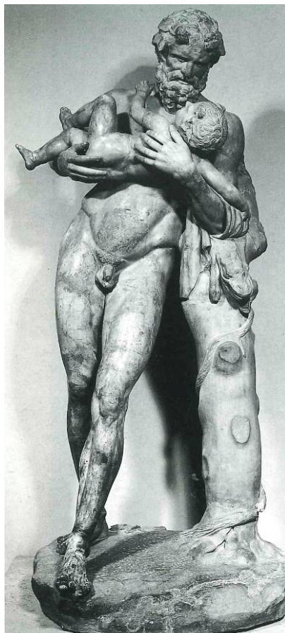
Figuras 8 y 9. San José con el Niño, Alonso Cano 1653-1657. Museo de Bellas Artes de Granada. Sileno con Dionisos niño, copia romana.